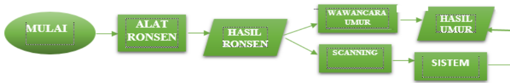
Gambar 3.1 Blok Diagram Sistem

Secara keseluruhan blok diagram tahapan dari proses perancangan sistem direpresentasikan sebagai berikut :