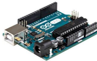
Gambar 2.2 Arduino uno [6]

Arduino adalah kit elektronik atau papan rangkain elektronik yang didalamnya memiliki komponen utama, yaitu sebuah chip mikrokontroler dengan jenis AVR dari perusahaan Atmel. Mikrokontroler itu adalah chip atau IC (intergrated circuit) yang bisa diprogram oleh komputer. Membuat program pada mikrokontroler agar rangkain elektronik membaca input tersebut dan menghasilkan output sesuai yang diinginkan. Jadi mikrokontroler bertugas sebagai otak yang mengendalikan input, proses dan output sebuah rangkaian elektronik. Arduino Uno merupakan board mikrokontroler yang mampu memberikan kemudahan kepada siapa saja yang hendak mengembangkan sistem dimana mikrokontroler sebagai pusat kendalinya.