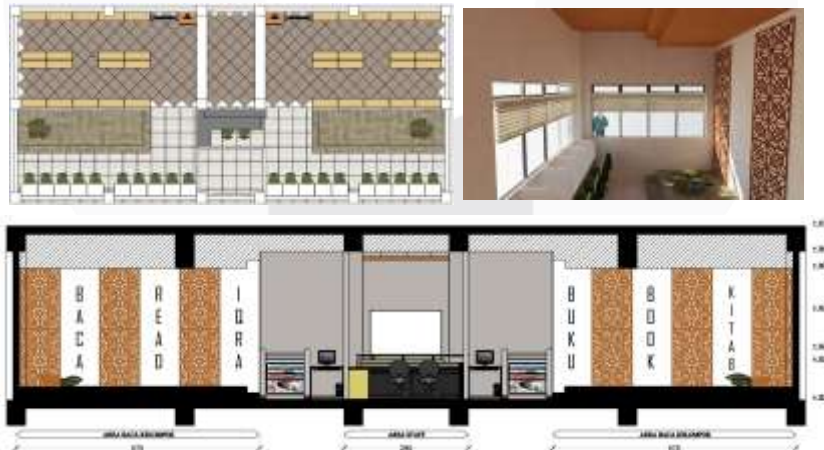
Gambar 6 Area Perpustakaan

Pada area perpustakaan meliputi beberapa fungsi ruang, yang fungsi utamanya sebagai sarana membaca siswa/i. Adapun area tersebut adalah, area staff, area buku, dan area baca. Area staff juga sebagai area informasi, yang berfungsi untuk memberikan informasi meminjam mengembalikan buku atau menanyakan hal lainnya. Pada area staff juga terdapat ruang untuk menjaga kualitas buku. Area buku terdiri dari rak - rak untuk menyimpan buku. Pada area membaca terdiri dari 2 bagian. Yaitu area membaca individu dan area membaca kelompok.