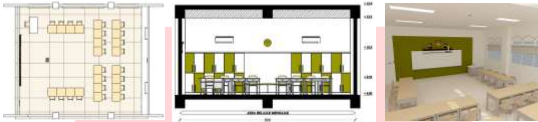
Gambar 5 Area Kelas Sumber : Karya Penulis

Pada area kelas hanya terdapat area belajar mengajar, yang fungsi utamanya adalah sebagai area belajar mengajar secara teori. Area kelas terdiri dari area untuk guru, untuk siswa/i, dan area penyimpanan.