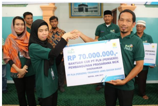
Gambar 1.5 Bantuan dana Pembangunan MCK dan Penanaman 1000 Pohon Jeruk Limo

Berdasarkan data di atas, dari keseluruhan program kegiatan CSR PT PLN (Persero) Transmisi Jawa Bagian Barat, partisipan terbanyak yang hadir terdapat dalam program Pembangunan MCK dan Penanaman 1000 Pohon Jeruk Limo sebanyak 268 partisipan, sedangkan program CSR yang paling sedikit partisipan yaitu Bantuan paket sembako sebesar 35 partisipan di lingkungan SMK Informatika dan SMP Utama. Program CSR Pembangunan MCK dan Penanaman 1000 Pohon Jeruk Limo ini dapat dikatakan program CSR PT PLN (Persero) Transmisi Jawa Bagian Barat yang paling sukses dan berhasil karena jumlah partisipan yang hadir dan tertarik untuk mengikuti kegiatan tersebut sangat banyak dibanding kegiatan CSR PT PLN (Persero) yang lainnya. Selain itu, pada program CSR ini, PT PLN (Persero) Transmisi Jawa Bagian Barat melakukan pengawasan dan penyuluhan terhadap Pembuatan MCK dan adanya pendampingan saat Penanaman Pohon Jeruk Limo, serta melakukan evaluasi dengan bekerjasama kepada pihak KRUPALA (Krukut Pencinta Alam).