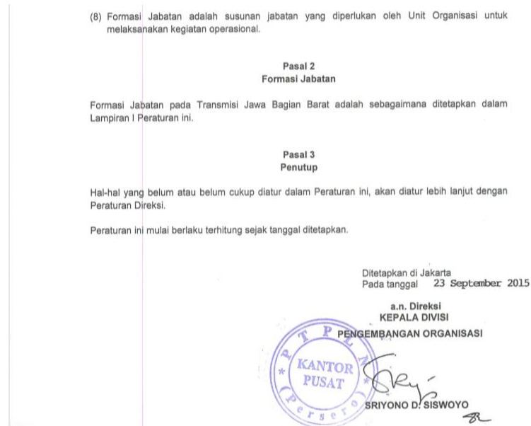
Gambar 1.4 Peraturan Direksi

Berdasarkan Peraturan Direksi yang telah ditetapkan, surat keputusan tersebut sudah di tanda tangan oleh Direksi Kepala Divisi Pengembangan Organisasi, Sriyono D. Siswoyo pada tanggal 23 September 2015 (terlampir).