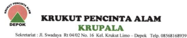
Gambar 1.7 Proposal Pengajuan Penanaman 1000 Pohon Jeruk Limo

Nomor : 015/Krupala/III/2017 Depok, 27 April 2017 Sifat : Lampiran : 1 bundel proposal Perihal : Permohonan Bantuan CSR Untuk Penanaman 1.000 Pohon Jeruk Limo Dilingkungan Jalur Sutet