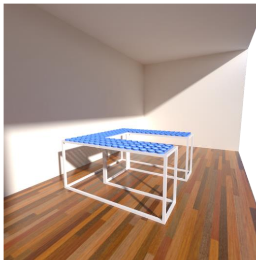
Gambar 5.2 Sketsa karya tampak samping