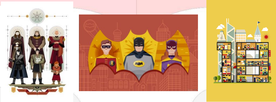
Gambar 2 Referensi Ilustrasi motion graphic