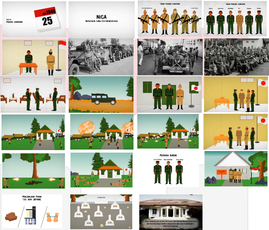
Gambar 10 hasil perancangan motion graphic