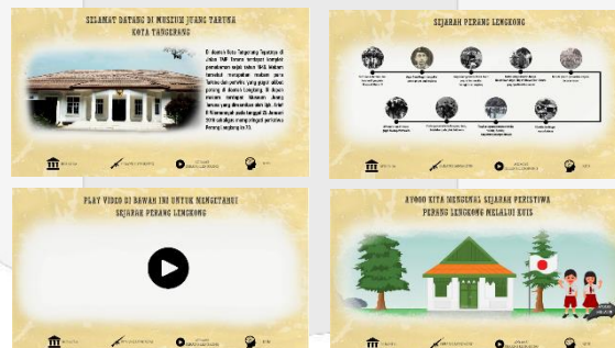
Gambar 9 Hasil Perancangan User Interface