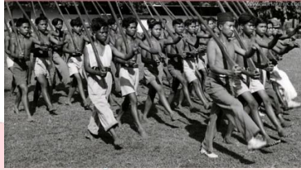
Gambar 1 Referensi foto sejarah peristiwa perang