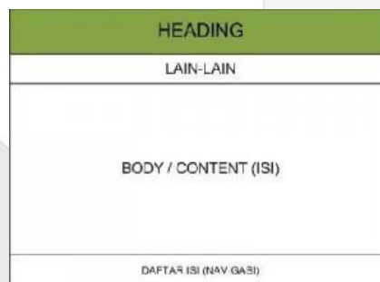
Gambar 3 Referensi Layout

Menggunakan bentuk layout bottom index karena pada perancangan ini membahas mengenai satu topik saja.