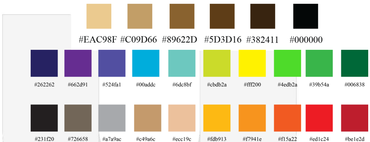
Gambar 8 Referensi Warna

Warna yang digunakan pada user interface menggunakan warna vintage yaitu turunan antara warna coklat muda dan hitam, dan menggunakan warna terang pada video motion graphic agar dapat menarik perhatian pengunjung.