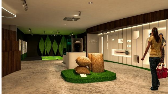
Area Peralatan Teh