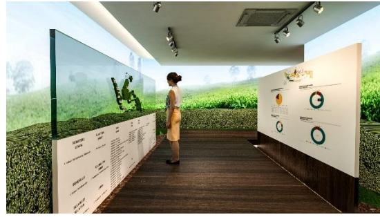
Area Produksi Teh