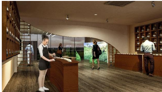
Area Tea Tasting Bar