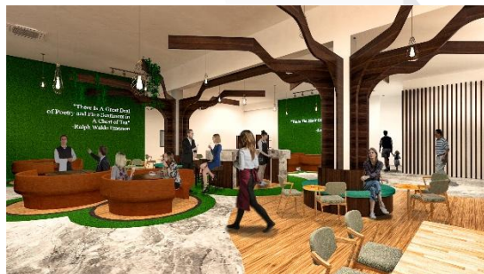
Area Tea Cafe