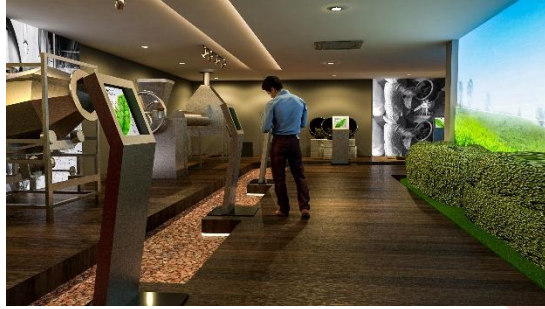
Area Perkebunan Teh