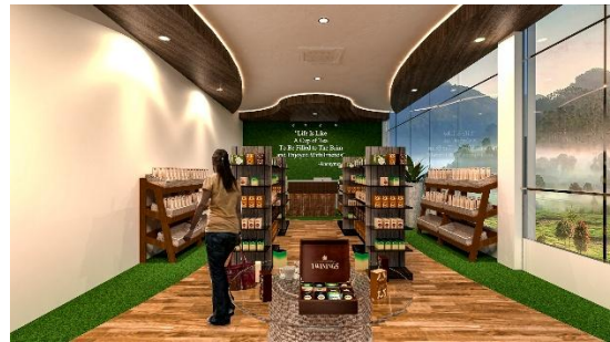
Area Tea Cafe