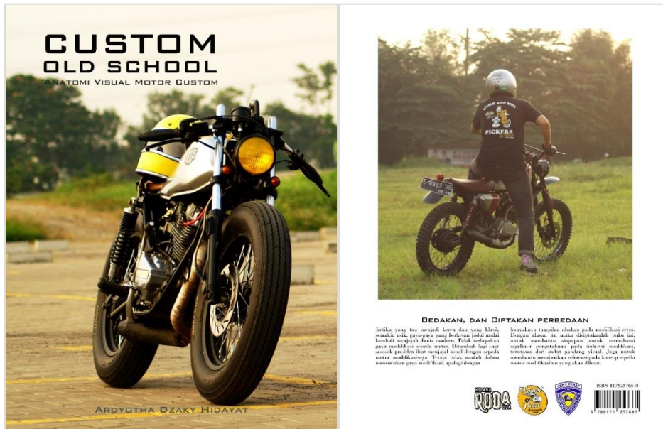
Gambar 1. Sampul Depan dan Belakang

Sinopsis: Ketika yang tua menjadi keren dan yang klasik semakin asik, gaya-gaya yang berkesan jadul mulai kembali menjajah dunia modern. Tidak terlupakan gaya modifikasi sepeda motor. Ditambah lagi saat sesosok presiden ikut menjajal aspal dengan sepeda motor modifikasi-nya. Tetapi tidak mudah dalam menentukan gaya modifikasi, apalagi dengan banyaknya tampilan ubahan pada modifikasi retro. Dengan alasan itu maka diciptakanlah buku ini, untuk membantu siapapun untuk memahami segelintir pengetahuan pada industri modifikasi, terutama dari sudut pandang visual. Juga untuk membantu memberikan referensi pada konsep sepeda motor modifikasimu yang akan dibuat.