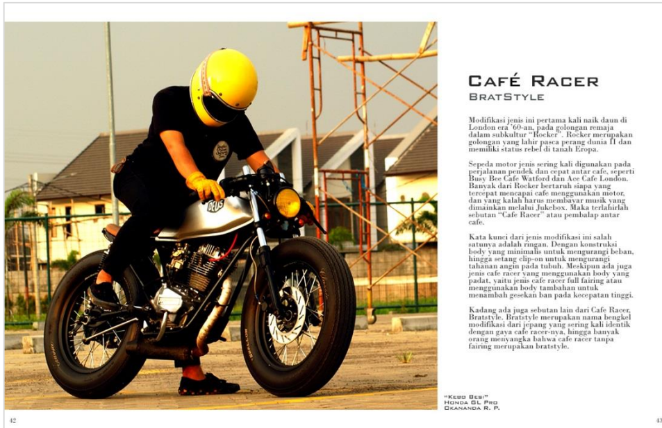
Gambar 3. Contoh Halaman Konten