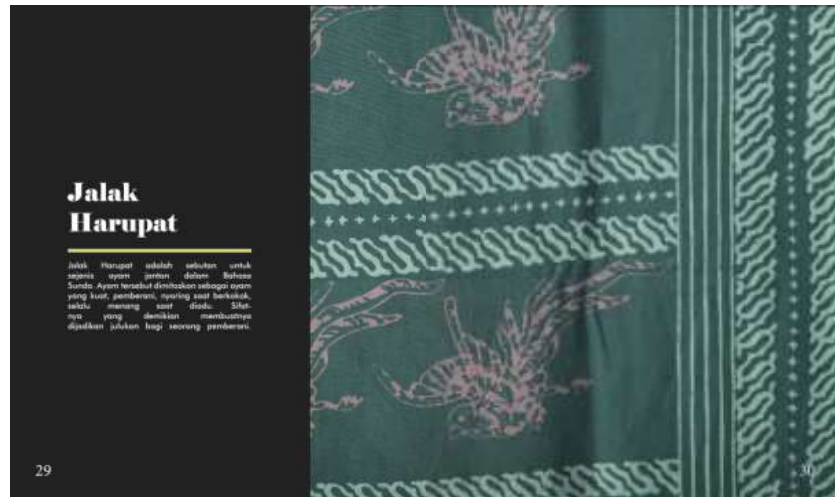
Gambar 3 Isi Halaman