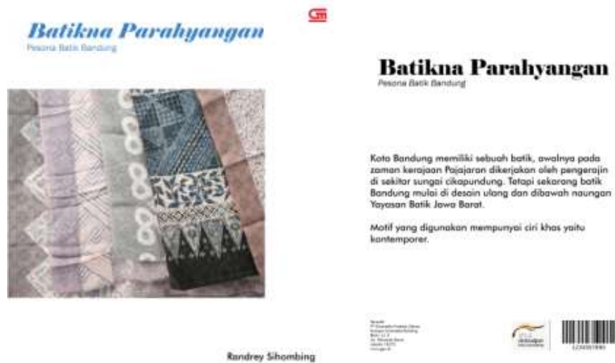
Gambar 1 Cover depan dan Cover belakang