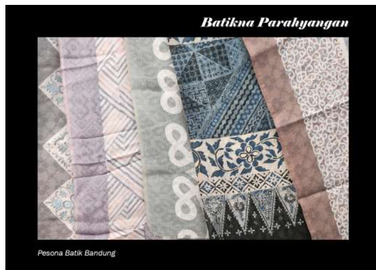
Gambar 4.13 Kartu Pos