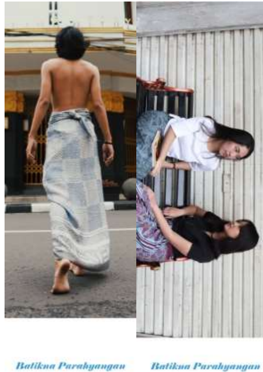
Gambar 4.14 Pembatas Buku