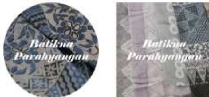
Gambar 4.15 Stiker