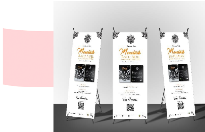
Gambar 4.52 Tampilan X Banner

Selain sosial media, merchandise pun turut dihadirkan sebagai media pendukung menarik minat masyarakat terhadap kebudayaan suku Samin. Dengan adanya merchandise ini, secara tidak langsung memberikan dampak untuk melestarikan dan memperkenalkan kepada masyarakat umum lainnya, karena dapat dipergunakan dikesehariaannya.