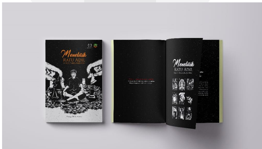
Gambar 4.2 Tampilan cover buku beserta isi buku