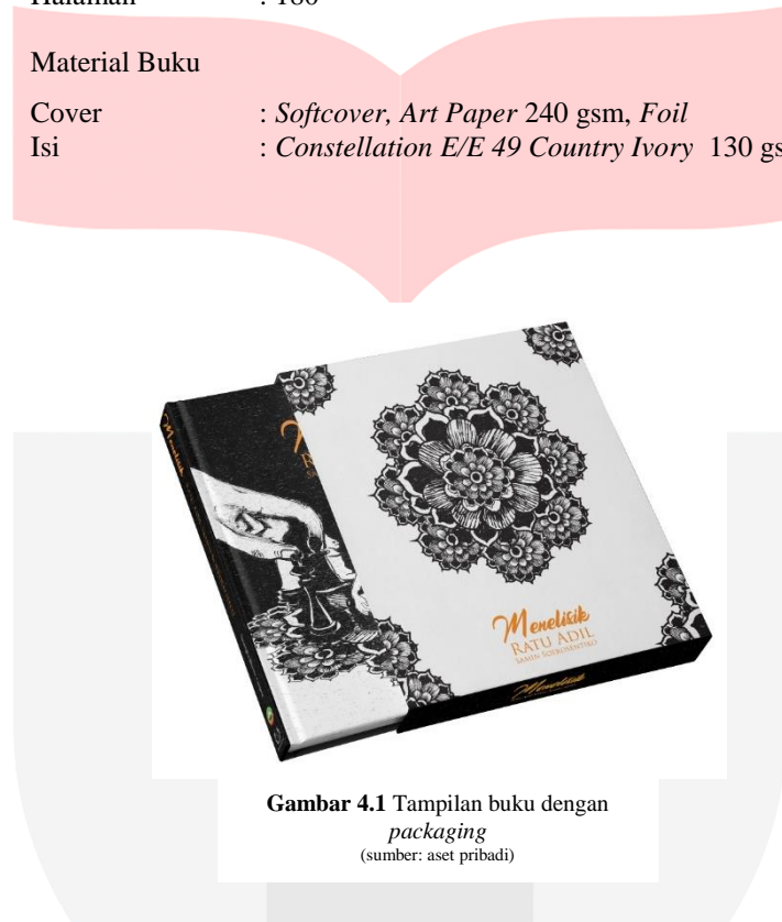
Gambar 4.1 Tampilan buku dengan packaging (sumber: aset pribadi)

Cover : Softcover, Art Paper 240 gsm, Foil Isi : Constellation E/E 49 Country Ivory 130 gsm