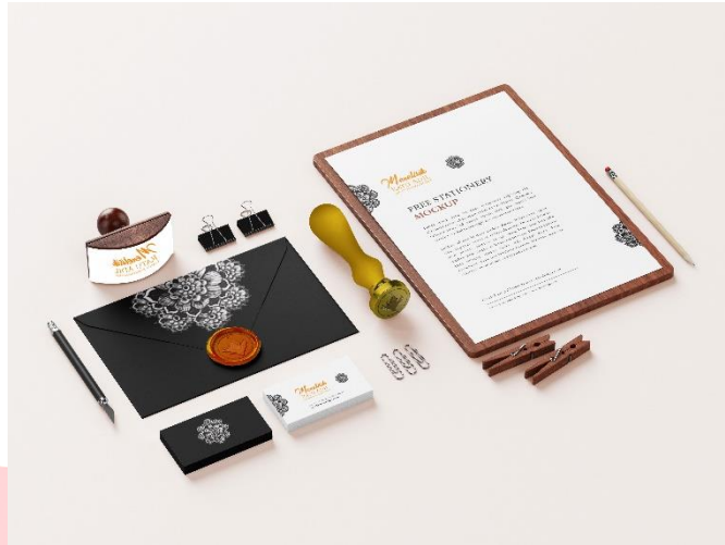
Gambar 4.54 Tampilan stationery