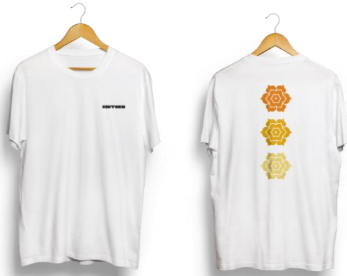
Gambar 4. 13 Perancangan Kaos