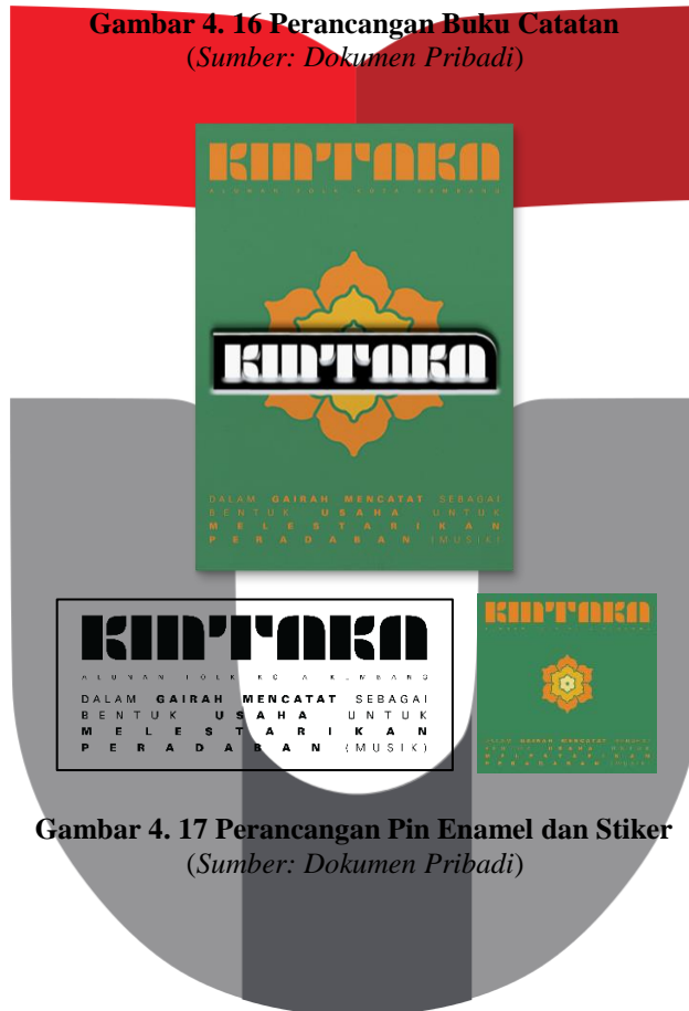
Gambar 4. 17 Perancangan Pin Enamel dan Stiker