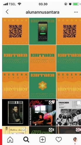
Gambar 4. 11 Perancangan Konten Sosial Media