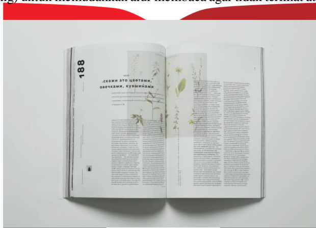
Gambar 4.1 Referensi Perancangan Layout

Prinsip perancangan layout yang digunakan adalah emphasis dengan tata letak teks serta konten ilustrasi yang keseimbangannya asimetris untuk memberikan kesan dinamis dan aktif, serta penggunaan white space atau negative space (ruang kosong) untuk memudahkan alur membaca agar tidak terlihat atau terkesan penuh dan sesak.