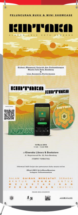
Gambar 4. 12 Perancangan XBanner