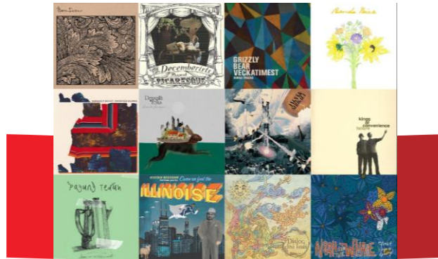
Gambar 4. 3 Referensi Perancangan Ilustrasi

Penggunaan ilustrasi dalam perancangan buku pencatatan atau arsip ini adalah ilustrasi dengan teknik vector digital painting . Kesan dari ilustrasi yang akan dihasilkan adalah ekspresif yang disesuaikan dengan karakteristik dari khalayak sasaran. Berikut adalah gaya visual dari ilustrasi folk yang biasa digunakan oleh musisi dan grup musik dari jenis atau aliran musik tersebut.