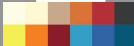
Gambar 4. 4 Penggunaan Palet Warna

Penggunaan warna disesuaikan dengan karakteristik yang sering ditampilkan para musisi folk dalam karyanya. Dengan membuat gabungan beberapa warna ke dalam satu palet warna yang memiliki kontras kurang atau sedikit buram dapat memberikan kesan yang dramatis dan puitis.