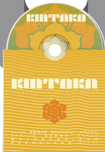
Gambar 4. 15 Perancangan Daftar Putar dalam Format CD