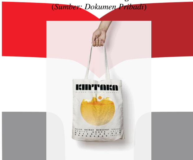
Gambar 4. 14 Perancangan Tas Jinjing