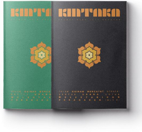
Gambar 4. 16 Perancangan Buku Catatan