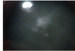
Gambar 4. Hasil Pre-processing .