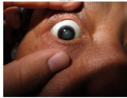
Gambar 3. Citra Mata Masukan.

Hasil dari proses pre-processing dilihat pada gambar 3 dan 4 dibawah ini.