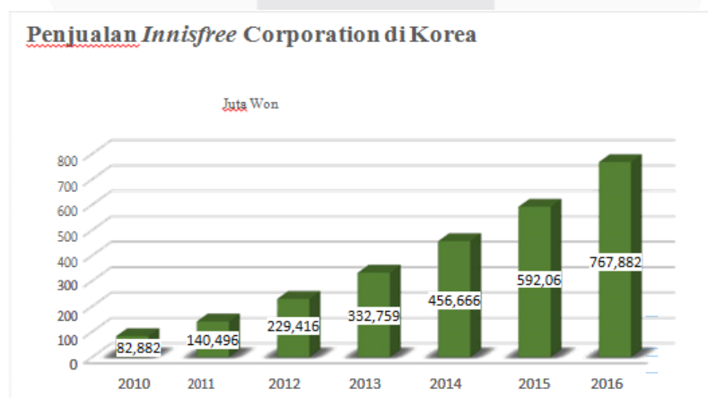
Gambar 1.1 Penjualan Innisfree di Korea

Di negara asalnya produk- produk Innisfree sebagai produk kosmetik dan perawatan kulit yang cukup banyak diminati. Hal ini dapat terlihat dari penjualan yang dihasilkan oleh Innisfree setiap tahunnya. Berikut adalah grafik dari penjualan produk Innisfree di Korea.