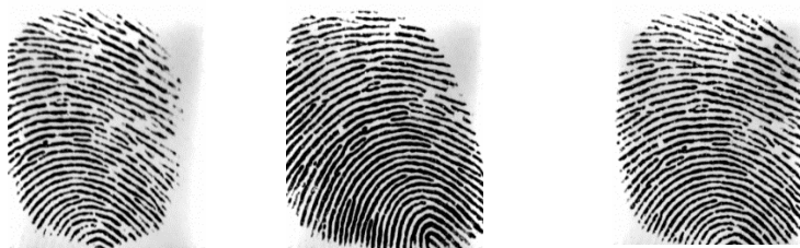
Gambar 2. Sampel Citra Dataset dari 1 orang

Data yang digunakan yaitu data gambar pindaian sidik jari dengan menggunakan mesin scanner berformat PNG dengan resolusi 330x260 pixel dari data sidik jari karyawan Telkom University. Digunakan sebanyak 60 data sidik jari dimana 20 citra merupakan data uji, dan 40 citra merupakan data latih. Satu orang memiliki 1 data uji dan 2 data latih. Sampel data yang digunakan akan di deskripsikan pada gambar 2.