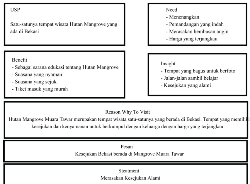
Gambar 4.1 Bagan analisis konsep pesan