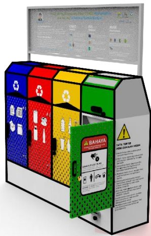
Gambar 5.2.3 Sketsa Akhir Tampak Perspektif (Sumber : Penulis, 2018)