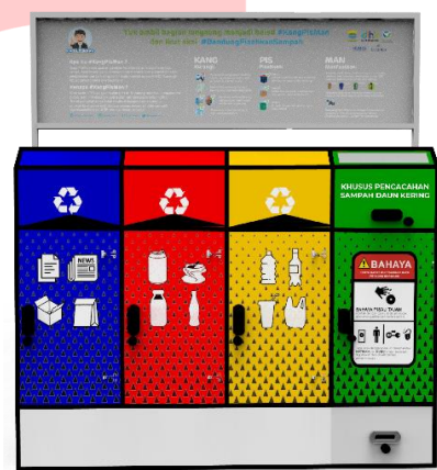
Gambar 5.2.1 Sketsa Akhir Tampak Depan