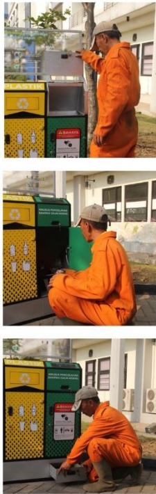
Gambar 5.5.1 Operasional Produk Oleh Petugas Kebersihan