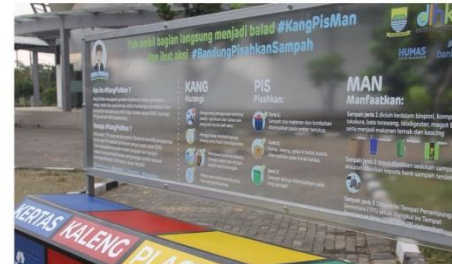
Gambar 5.4.1 Foto Produk Akhir