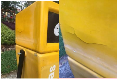
Gambar 2.2 Material pada tempat sampah Taman Balai Kota

sampah sudah terdapat retakan dan mengelupas.