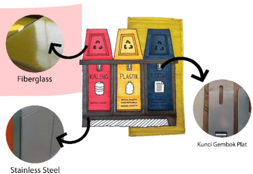
Gambar 4.3 Sketsa Alternatif 1