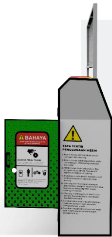
Gambar 5.2.4 Sketsa Akhir Tampak Samping