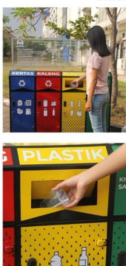
Gambar 5.5.2 Operasional Produk Oleh Pengunjung