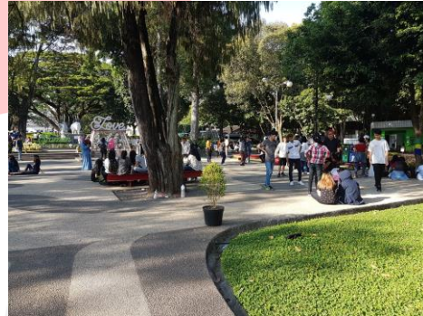
Gambar 2.1 Taman Balai Kota Bandung

sebidang tanah yang ditumbuhi beberapa pohon-pohon besar. Namun saat ini sudah di lakukan revitalisasi pada taman ini. Taman Balai Kota memiliki luas 870 meter, terdapat kolam dangkal ditengah taman yang dirancang untuk memberikan wahana rekreasi untuk anak-anak.