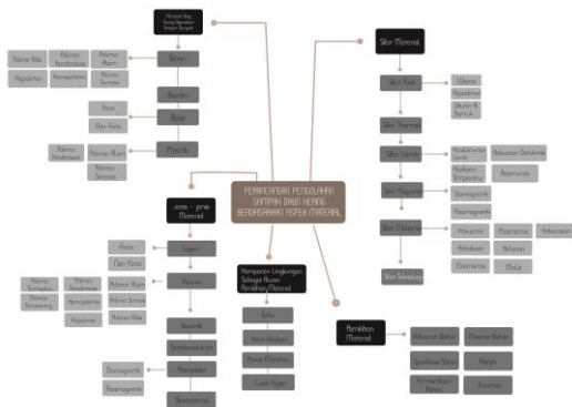
Gambar 4.1 Mind Mapping Material