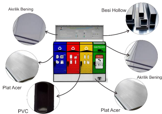
Gambar 5.3.1 Pengaplikasian Material