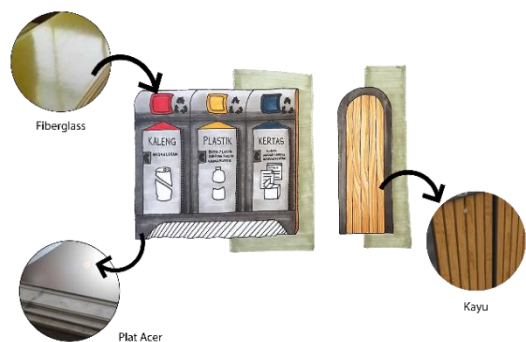
Gambar 4.5 Sketsa Alternatif 3