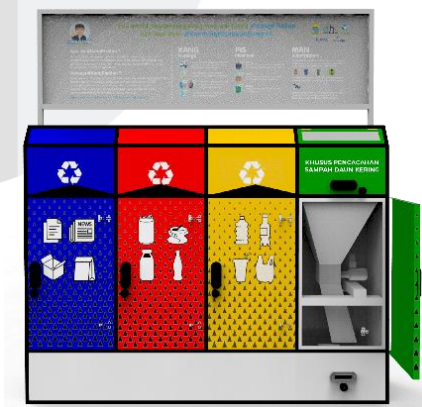
Gambar 5.2.2 Sketsa Akhir Tampak Dalam Mesin