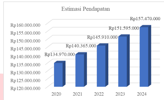
Gambar 2 Estimasi Pendapatan

Estimasi pendapatan yang akan diperoleh Clean&Care selama lima tahun kedepan didapatkan dari jumlah demand dengan harga jual pada tiap tahun. Berikut merupakan estimasi pendapatan Clean&Care: