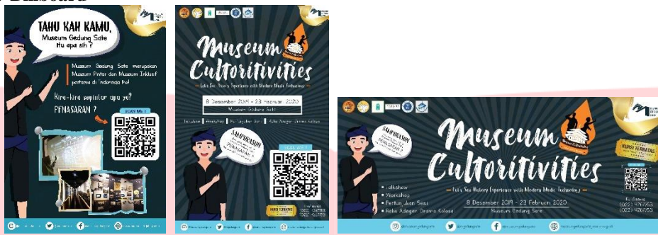
Gambar 3.4.5 Hasil Rancangan Billboard