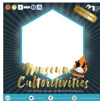
Gambar 3.4.11 Hasil Rancangan Twibbon