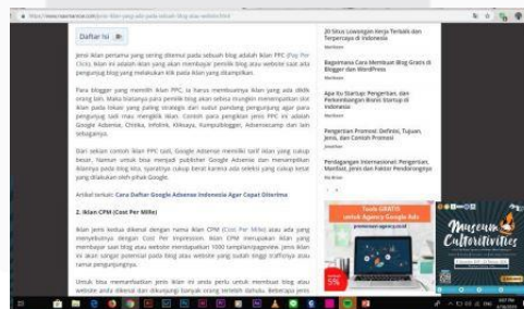
Gambar 3.4.8 Hasil Rancangan Adsense Ads