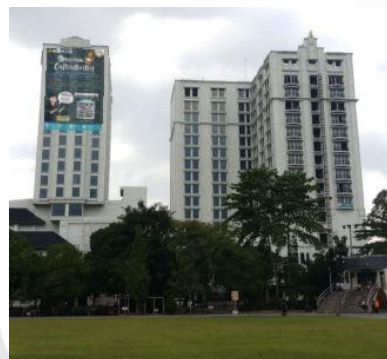
Gambar 3.4.7 Hasil Rancangan Ambient Media