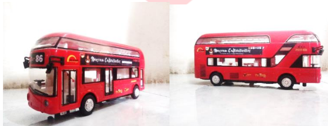
Gambar 3.4.6 Hasil Rancangan Mobile Ads