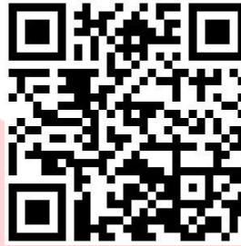
Gambar 3.4.9 Hasil Rancangan QR Code