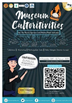
Gambar 3.4.3 Hasil Rancangan Poster Utama