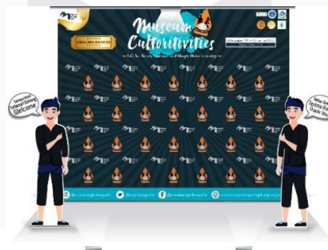
Gambar 3.4.10 Hasil Rancangan Photobooth