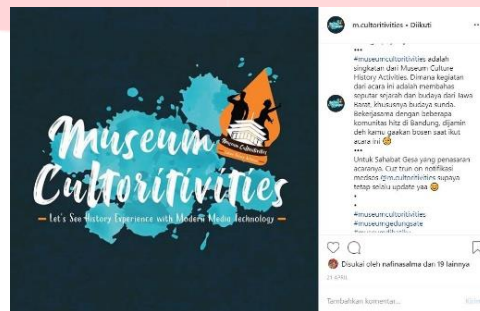
Gambar 3.4.10 Hasil Rancangan Hastag pada social media