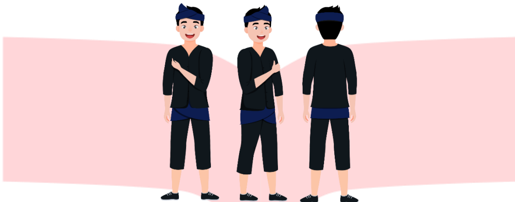
Gambar 3.4.2 Hasil Rancangan Maskot dari Program Tematik Museum Cultoritivities