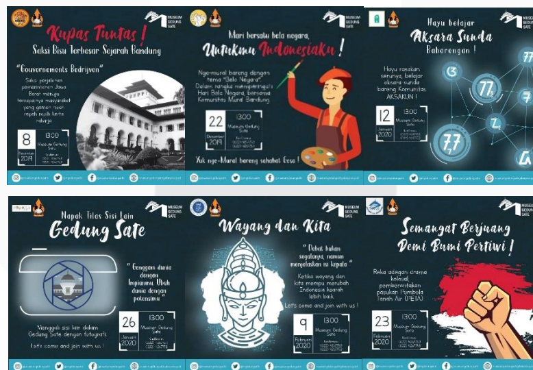
Gambar 3.4.4 Hasil Rancangan Poster Tematik