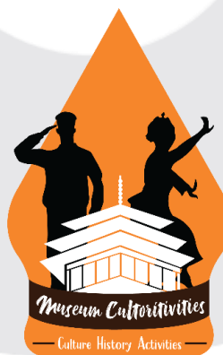
Gambar 3.4.1 Hasil Rancangan Logo Program Tematik