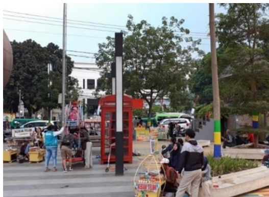
Gambar 2. Fasilitas Perpustakaan Mini Alun-Alun Ujungberung

Selain dua poin sebelumnya, penulis juga telah melakukan survey lapangan guna mengobservasi permasalahan yang terjadi. Berikut ini adalah data-data dokumentasi dari survey yang telah dilakukan :