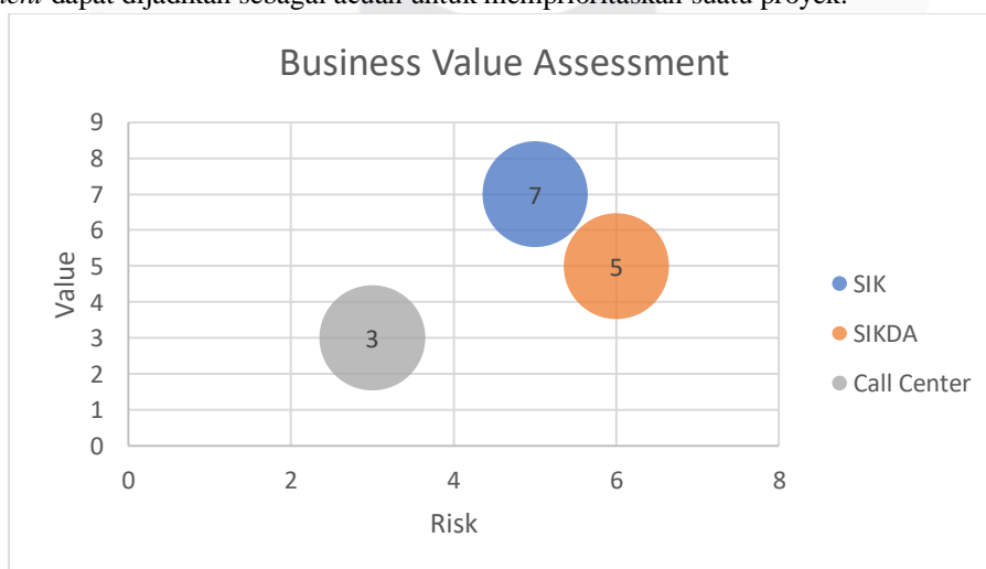
Gambar 3 Business Value Assessment Technique

Business value Assesment artefak yang menggambarkan nilai bisnis kedalam sebuah matrix artefak business values Assesment dapat dijadikan sebagai acuan untuk memprioritaskan suatu proyek.