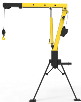
Gambar 3 Produk Final

Membuat mini crane dengan sistem manual tanpa menggunakan mesin agar satwa dan pengunjung tidak terganggu terhadap aktivitas perawatan kandang, khususnya penggantian kayu di kandang harimau sumatera.