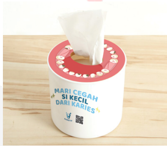
Gambar 2. Ambient Media Tempat Tisu