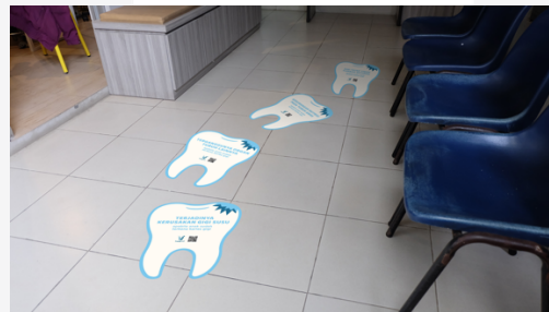
Gambar 7. Mock Up Sticker Lantai