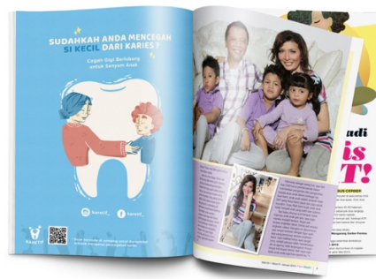
Gambar 13. Mock Up Iklan Majalah