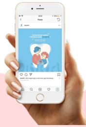
Gambar 9. Mock Up Konten Media Sosial