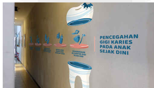
Gambar 8. Mock Up Sticker Dinding