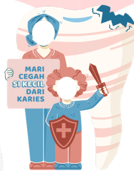
Gambar 10. Photobooth