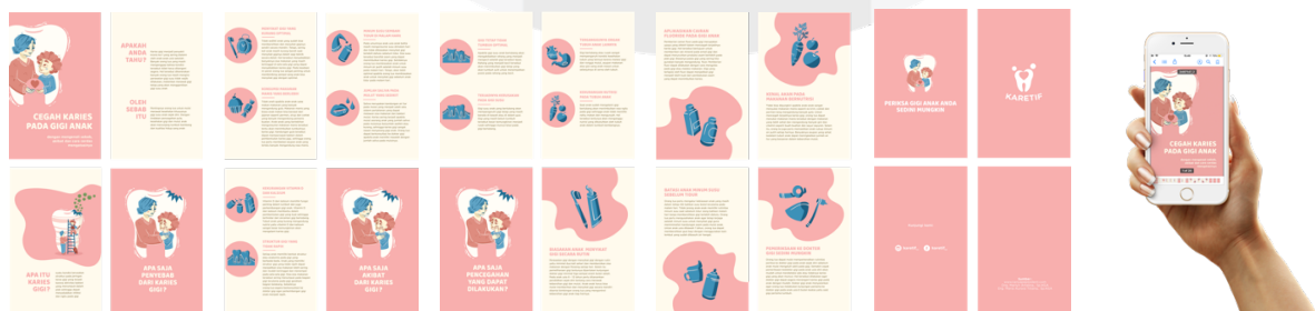
Gambar 4. E-book