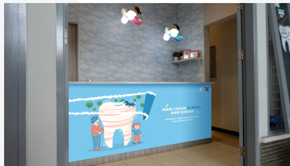
Gambar 3. Mock Up Meja Resepsionis (Sumber: Haliza Octamediana, 2019)