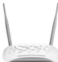
Gambar 1 Access Point

Access point adalah perangkat jaringan yang mampu menciptakan jaringan local nirkabel. Access point berfungsi untuk melakukan transmisi dan penerimaan sinyal dari client sehingga memungkinkan antar perangkat dapat terhubung ke jaringan wireless dengan menggunakan SSID yang sama. Gambar 1 berikut menunjukkan bentuk fisik access point .