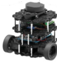
Gambar 1. TurtleBot 3

dipasang sistem operasi Robot Operating System (ROS) yang berfungsi sebagai pengolah data dan otak utama pada TurtleBot 3.