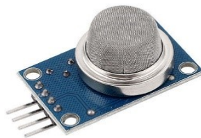
Gambar 3. Sensor Gas tipe MQ-2

Sensor merupakan sebuah komponen yang berfungsi untuk mengubah sinyal fisik menjadi sinyal elektronik yang dibutuhkan komputer. Sensor gas merupakan komponen yang dapat mengukur kandungan gas pada suatu ruangan dan pada titik tertentu. Karakteristik dari sensor gas adalah menghasilkan nilai digital yang dikonversikan sesuai dengan tingkatan yang telah dibagi-bagi sesuai dengan kandungan gas tersebut. Sensor gas yang digunakan adalah sensor gas bertipe MQ-2. MQ-2 adalah sensor gas yang memiliki sensitivitas tinggi terhadap jenis gas yang mudah terbakar seperti LPG, Propana, dan Hidrogen. Selain memiliki sensitivitas tinggi, MQ-2 dipilih karena harganya yang murah dan cocok untuk diaplikasikan pada objek yang berbeda-beda. Sensor gas MQ-2 Sensor nantinya dikonfigurasi melalui OpenCR. Dalam OpenCR, diatur sesuai dengan batas bawah dan batas atas gas yang akan dideteksi, sehingga menghindari pembacaan data yang menyesatkan. Karena sensitivitasnya yang tinggi dan waktu respons yang cepat, pengukuran dapat dilakukan sesegera mungkin. Dengan menempatkannya dalam tiga arah yang berbeda, nilai yang diperoleh akan lebih akurat dan tepat.