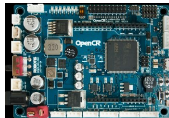
Gambar 2. OpenCR

OpenCR menyediakan pin input / output digital dan analog yang dapat berinteraksi dengan board ekstensi atau berbagai jenis sensor. Memanfaatkan OpenCR yang kompatibel dengan Arduino IDE, program deteksi kebocoran gas menggunakan Bahasa C sebagai dasar untuk pemrogramannya. Dengan demikian, pemrosesan data tidak memerlukan terlalu banyak memori dan dapat mengurangi penggunaan daya baterai yang telah digunakan untuk memindahkan dan memproses data dari SLAM. Setelah data diperoleh oleh OpenCR, data mengenai kebocoran gas di kumpulkan pada Raspberry Pi 3 untuk diproses didalam ROS dan membentuk grafik sesuai dengan data yang ada.