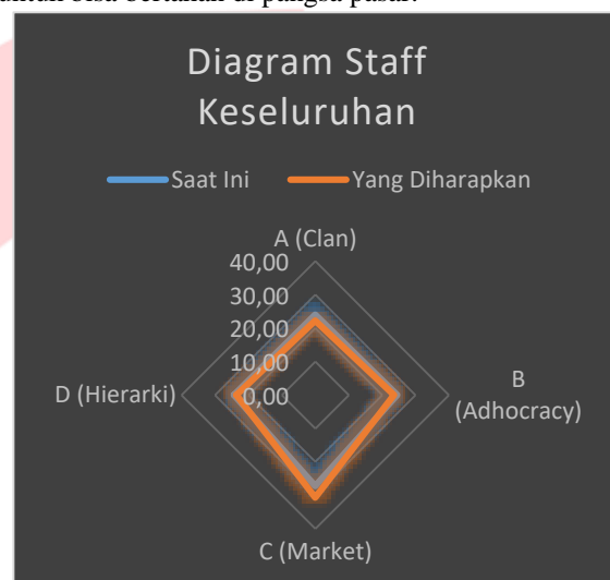
Gambar 3. Hasil Kuesioner Ocai Staff