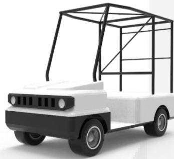
Gambar 2. Rangka kendaraan