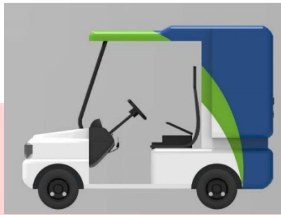
Gambar 4. Sketsa kendaraan tampak samping