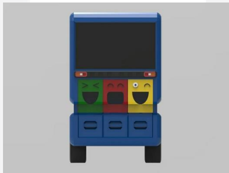
Gambar 7. Sketsa kendaraan tampak belakang