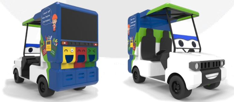
Gambar 3. Sketsa kendaraan perspektif