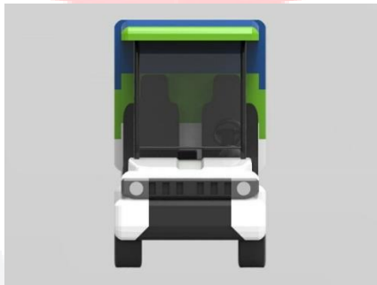
Gambar 6. Sketsa kendaraan tampak depan