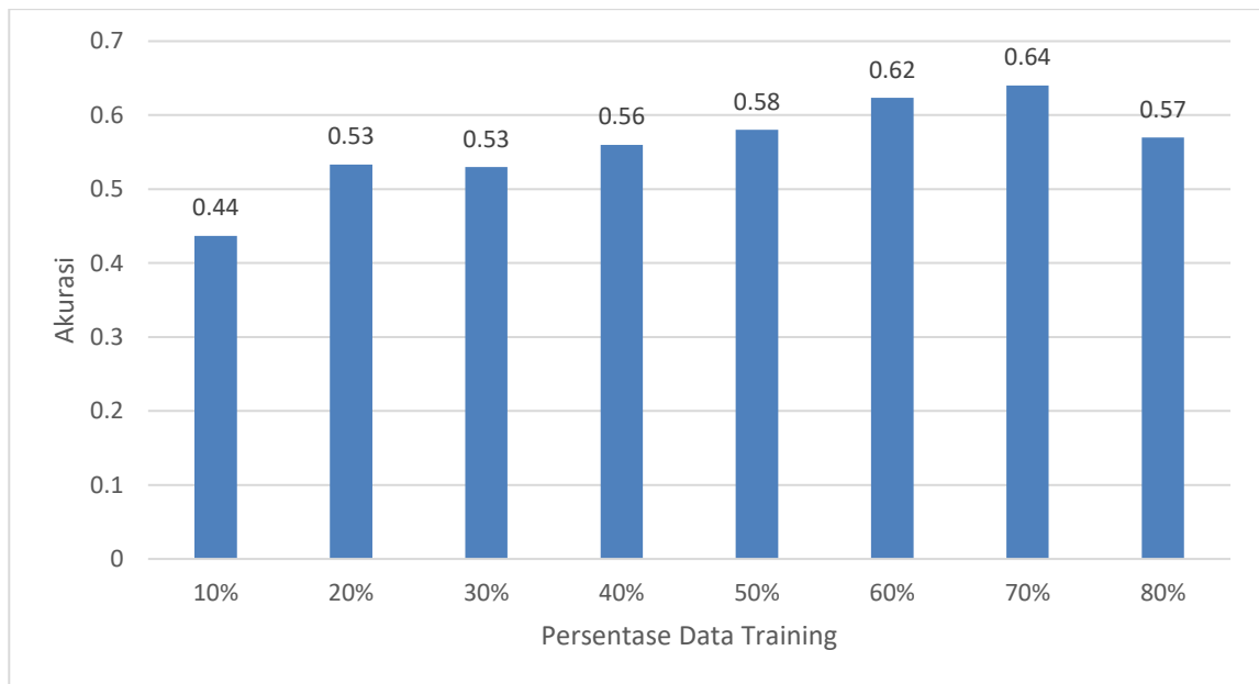
Gambar 4. Grafik nilai akurasi percentage-splitting

Pengujian perbandingan komposisi data training dan data testing ini dilakukan dengan menggunakan percentage-splitting untuk mengetahui pengaruh pada model yang dibuat oleh sistem klasifikasi. Pengujian ini dilakukan dengan menguji beberapa percentage-splitting dari data training dan data testing kemudian dibandingkan hasil dari masing-masing komposisi. Data yang ada dibagi menjadi 8 komposisi data training dan data testing , yaitu 20%-80%, 30%-70%, 40%-60%, 50%-50%, 60%-40%, 70%-30%, 80%-20%, dan 90%-10%. Pengujian percentage-splitting dilakukan pada data training berguna agar model yang didapatkan memiliki kemampuan dalam hal generalisasi untuk melakukan klasifikasi data. Hasil pengujian dapat dilihat pada gambar 4 :