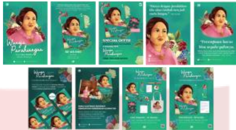
Gambar 2. Poster