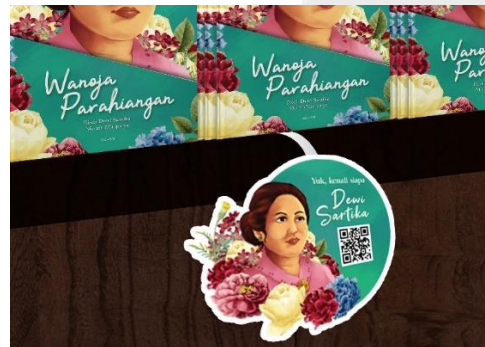
Gambar 7. Wobbler

Wobbler pertama berisi ilustrasi Dewi Sartika yang mengarahkan khalayak sasaran untuk mengenal Dewi Sartika. Penggunaan wobbler dapat membantu berjalannya metode AIDA yang telah dijelaskan pada konsep kreatif.