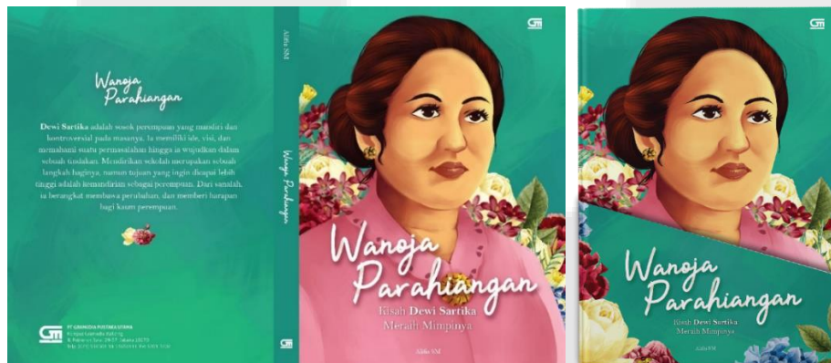
Gambar 1. Sampul Buku