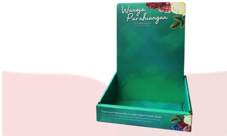
Gambar 8. Retail Cardboard Book Counter Display