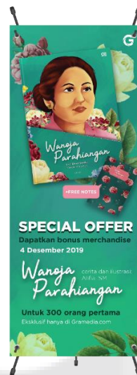
Gambar 3. X-Banner

Dalam metode AIDA, x-banner memiliki fungsi sebagai attention , dimana informasi yang ada di dalamnya mampu menarik perhatian khalayak sasaran mengenai produk.