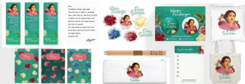
Gambar 5. Merchandise (Pembatas buku, kartu terimakasih, stiker, pin, bantal, buku catatan, pensil, tempat pensil, daftar kegiatan, dan tas tote)

Penerapan ilustrasi Dewi Sartika akan diterapkan pada merchandise sebagai bonus ketika pembeli membeli produk buku ilustrasi edisi reguler atau edisi terbatas. Dalam metode AIDA, merchandise memiliki fungsi sebagai desire .