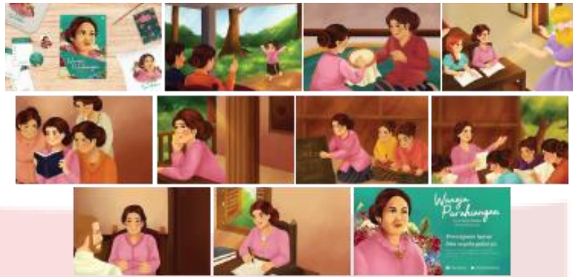
Gambar 4. Storyboard Book Trailer