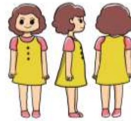
Gambar 4 Karakter Bitu

Bitu adalah anak perempuan berusia lima tahun. Karakternya memiliki sifat yang ingin serbatahu, mandiri, dan pintar. Namun Ia sering menghabiskan waktunya di dalam rumah.