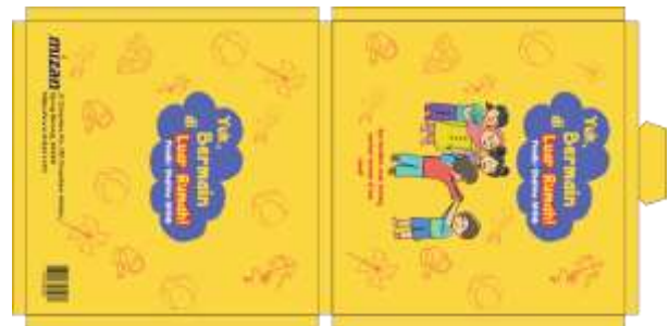
Gambar 12 Kemasan Buku