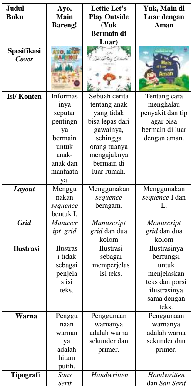
Tabel 1 Analisis Data Proyek Sejenis

Adapun hasil analisis data proyek sejenis di atas sebagai berikut: