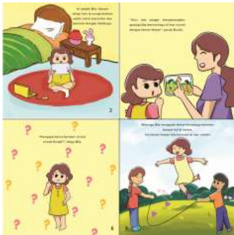
Gambar 9 Isi Buku

Berikut adalah salah satu sub cerita yang dibuat. Seluruh cerita yang dibuat menyesuaikan aspek tumbuh kembang anak.