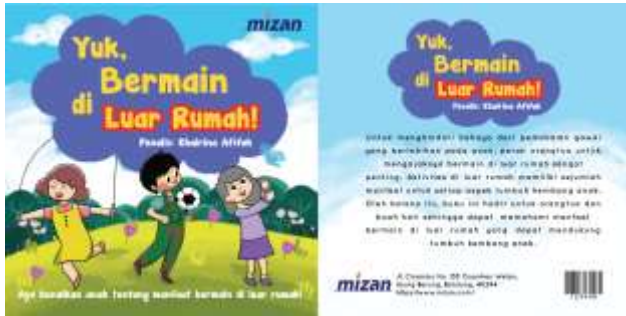
Gambar 8 Cover Buku

Desain cover buku ilustrasi yang dibuat menggunakan warna warna cerah agar anak-anak tertarik untuk melihat buku. Selain itu tipografi yang digunakan menggunakan jenis handwritten , agar terlihat menarik untuk judul buku. Ilustrasi yang digunakan menggunakan latar tempat di luar rumah sesuai dengan topik bermain di luar rumah.