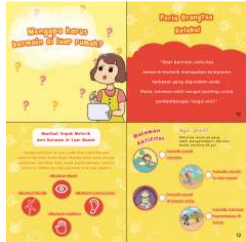
Gambar 10 Interaktif pada Buku (Sumber: Data Pribadi)

Setiap akhir sub bab cerita terdapat sejumlah interaktif yaitu terdapat sebuah quote , fakta, dan interaktif game yang menyesuaikan tema di setiap sub bab cerita.