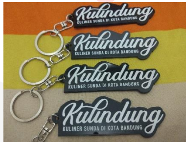
Gambar Gantungan Kunci