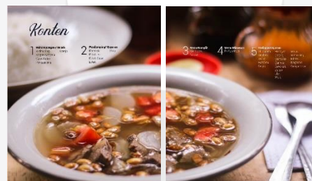
Gambar Daftar Isi