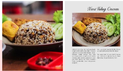
Gambar Halaman Isi