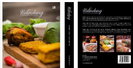
Gambar Cover depan tengah dan belakang