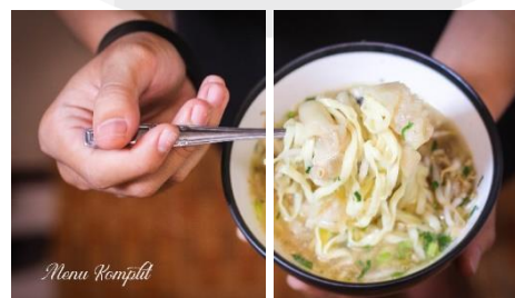
Gambar Halaman Kategori Isi