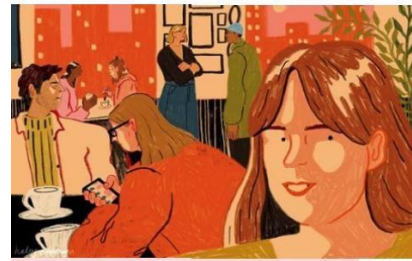
Gambar 3 Referensi Style

tempat yang hangat dan menerima sang remaja untuk berkeluh kesah.