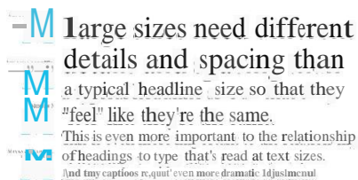
Gambar 1 Font MinionVariable Concept

Penyampaian pesan menggunakan ilustrasi dan juga text. Typeface yang akan digunakan untuk judul adalah Minion Variable Concept, sementara untuk body text menggunakan Adobe Caslon Regular. Keduanya tergolong dalam jenis font yang sama, yaitu serif. Font serif digunakan karena memiliki citra intelektual dan elegan, menggambarkan materi yang akan disampaikan kepada orang tua. Citra intelektual yang dibangun memiliki tujuan untuk meyakinkan khalayak sasaran akan konten yang terdapat dalam buku. Readability kedua font dapat dibaca dengan baik dan memiliki visibility yang cukup. Font serif mengarahkan arah mata pembaca sehingga tidak mempersulit pembaca.