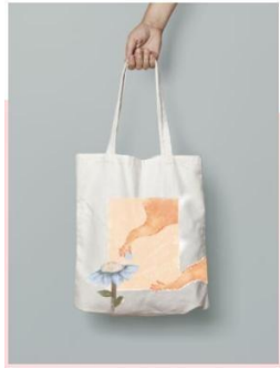
Gambar 5 Mockup Totebag