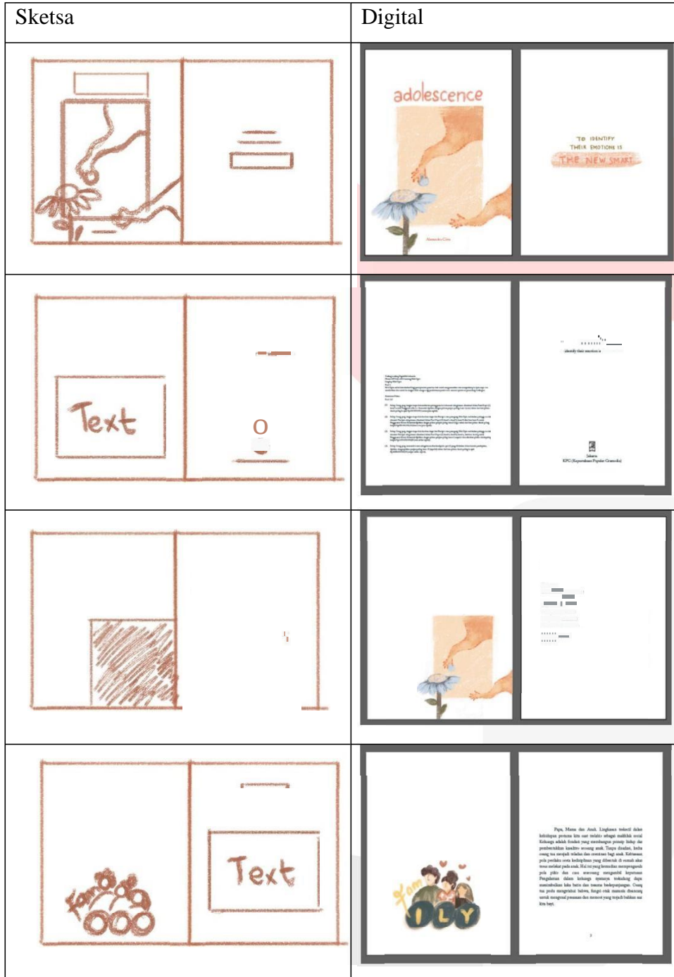
Tabel 1 Sketsa dan Hasil Digital