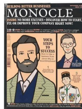
Gambar 4 Referensi Layout

Perancangan dari segi visual dan layout menggunakan ilustrasi digital. Karya diolah secara digital juga untuk di layout. Pemilihan ilustrasi yang memiliki garis yang lebih dinamis seperti gambar 3 bertujuan untuk menyesuaikan dengan tema keluarga yang bersifat dinamis, sebisa mungkin tidak kaku atau canggung. Pada bagian detail wajah, tidak memperlihatkan mimik dari masing-masing karakter yang dibuat. Tidak seperti pada anak-anak, orang dewasa umumnya tidak terfokus pada ekspresi melainkan penyampaian pesan dari kombinasi aspek lainnya.