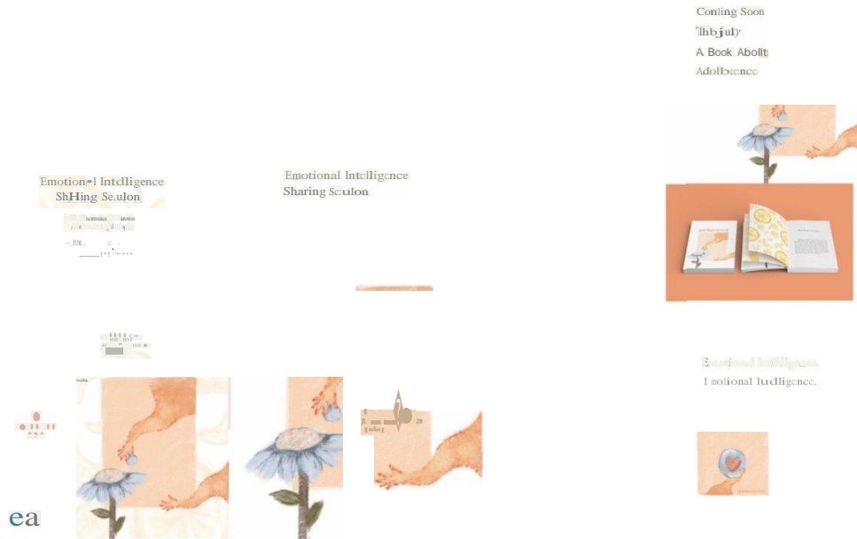
Gambar 11 Poster