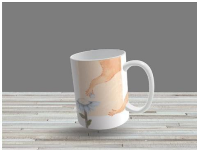
Gambar 7 Mockup Mug