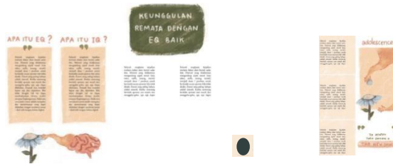
Gambar 9 Folded Brochure