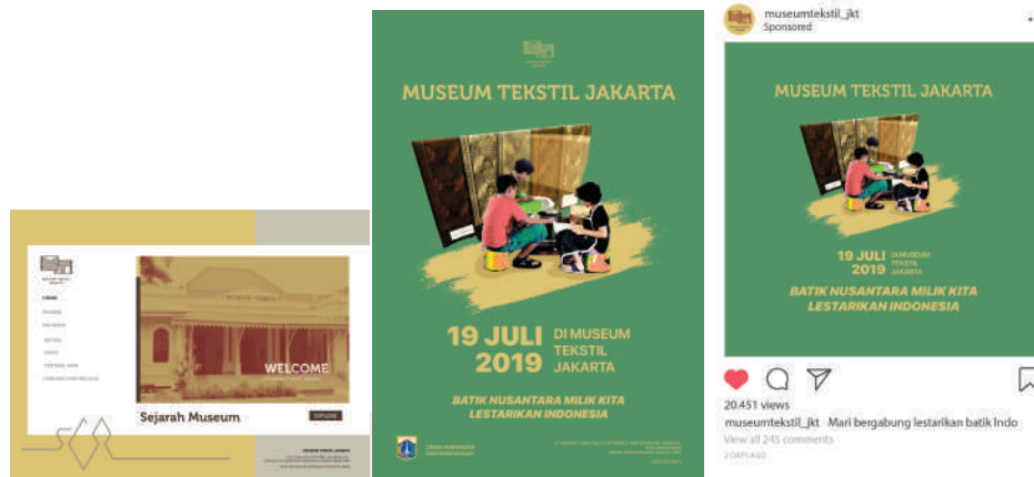
Gambar 5.5 Media Promosi