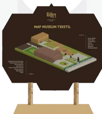
Gambar 5.3 Peta 2D dan 3D