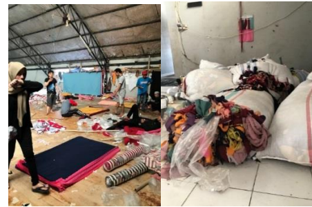
Gambar 1&2 Observasi di konfeksi ratu reyhan konfeksi kawasan soreang

Data lapangan dilakukan dengan wawancara serta observasi dilakukan ke 3 tempat konfeksi yang berada di Kawasan Soreang didampingi oleh owner dari masing-masing konfeksi. Ketiga tempat konfeksi di Kawasan Soreang ini memiliki jenis limbah dengan dimensi ukuran yang berbeda-beda.