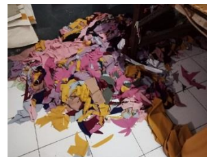
Gambar 3 Observasi di konfeksi sofha konfeksi kawasan soreang