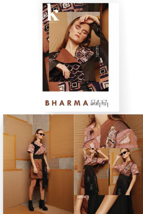
Gambar 6 Visualisasi produk

Eksplorasi terpilih tersebut kemudian diaplikasikan pada produk fesyen berupa ready to wear deluxe sebanyak 4 looks. Berikut merupakan visualisasi produk hasil dari penelitian ini: