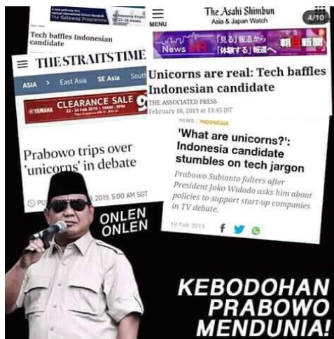
Gambar 4.2 Meme Kebodohan Prabowo