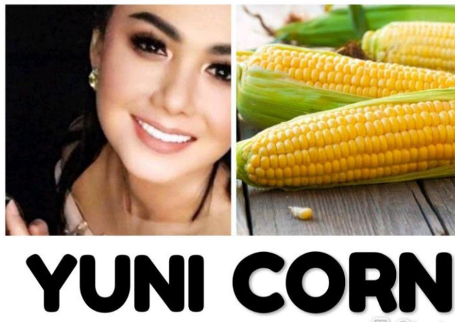
Gambar 4.1 Meme Yunicorn