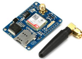
Gambar III-4 Modul SIM800C

Pada sistem ini, modul SIM800C berfungsi untuk mengirim dan menerima data dari mikrokontroler dan aplikasi android melalui komunikasi serial GPRS ( General Packet Radio Service ). Modul SIM800C ditunjukkan pada Gambar III-4 berikut :