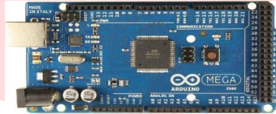
Gambar III-2 Arduino Mega

Board Arduino Mega 2560 adalah sebuah Board Arduino yang menggunakan ic Mikrokontroler ATmega 2560. Board ini memiliki Pin I/O yang relatif banyak, 54 digital Input / Output, 15 buah di antaranya dapat di gunakan sebagai output PWM, 16 buah analog Input, 4 UART. Arduino Mega 2560 di lengkapi kristal 16. Mhz Untuk penggunaan relatif sederhana tinggal menghubungkan power dari USB ke PC / Laptop atau melalui Jack DC pakai adaptor 7-12 V DC.