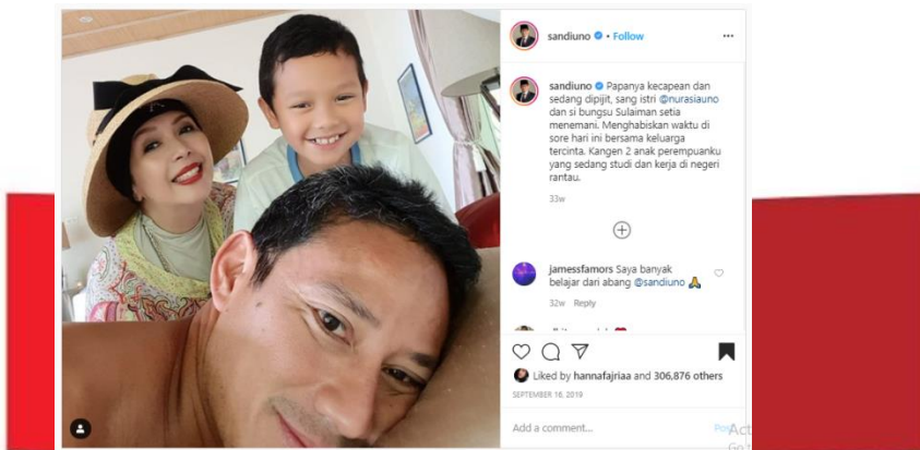
Gambar 3. Unggahan pada tanggal 16 September 2019