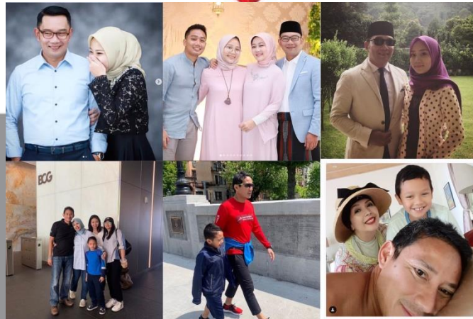
Gambar 1. Unggahan foto akun Instagram @Ridwankamil dan @Sandiuno

Foto diatas merupakan unggahan foto yang peneliti pilih berdasarkan jumlah likes terbanyak pada akun Instagram @ridwankamil dan @sandiuno bersama keluarga. Tiga baris diatas merupakan tiga dari 12 unggahan foto dengan jumlah likes terbanyak oleh Ridwan Kamil bersama keluarga dan tiga baris dibawah merupakan tiga unggahan foto dengan jumlah likes terbanyak oleh Sandiaga Uno bersama keluarga. Namun, peneliti hanya memilih satu foto dari masing-masing Ridwan Kamil dan Sandiaga Uno. Berikut analisis peneliti dengan menggunakan analisis multimodal Kress dan Van Leeuwen: