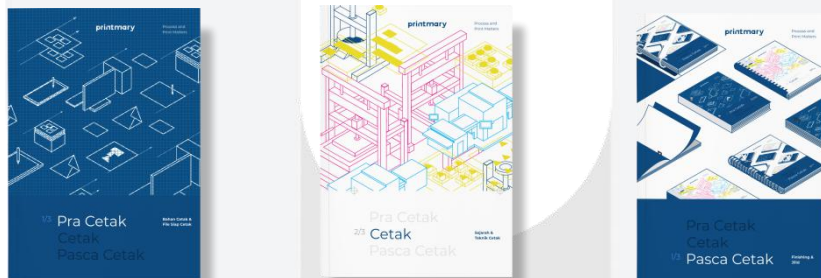
Gambar 1 Cover Buku

Media utama hasil perancangan ini adalah buku “printmary” buku mengenai proses, teknik dan bahan cetak beserta contoh langsung didalamnya. Pernacangan ini dibagi menjadi 3 buku yaitu : Buku Pracetak, Buku Cetak dan Buku Pasca Cetak. Masing- masing buku ini memiliki 48 halaman untuk buku pracetak, 72 halaman untuk buku cetak dan 64 halaman untuk buku pasca cetak, dengan ukuran masing-masing adalah A5.