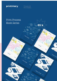
Gambar 3 Media Pendukung ; Poster

Media pendukung berfungsi untuk membantu penyebaran serta membantu untuk mengkomunikasikan media utama kepada target. Media pendukung yang digunakan adalah : Poster, Flyer, Paperpack, Stiker, Notebook, dan konten sosial media.