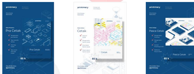
Gambar 4 Media Pendukung ; Flyer