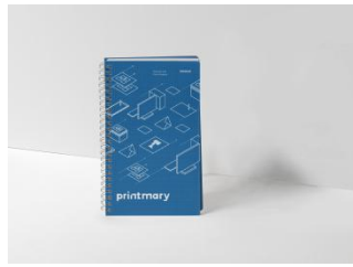
Gambar 7 Media Pendukung ; Notebook