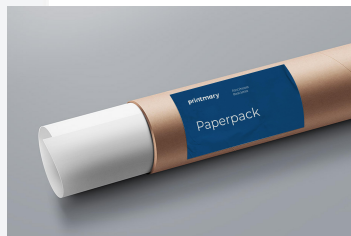
Gambar 5 Media Pendukung ; Paperpack