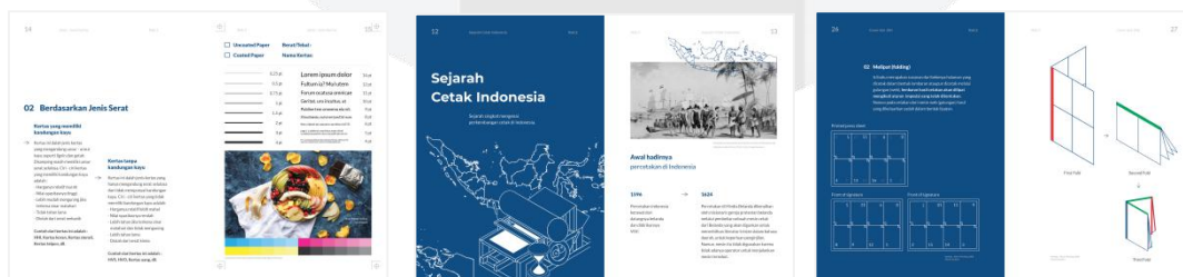
Gambar 2 Isi Buku