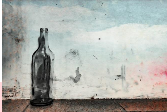
Gambar 3. 7 Sketsa karya 3.