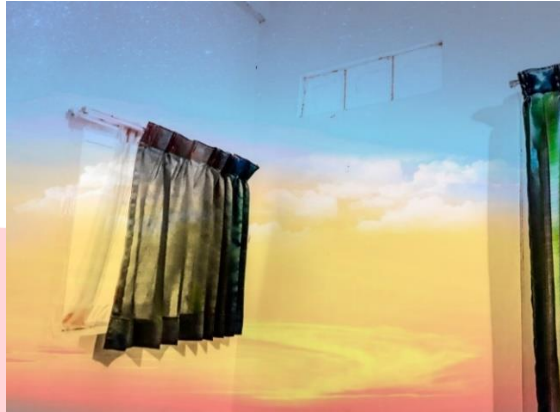
Gambar 3. 5 Sketsa karya 2.

Namun dalam pengerjaan nya penulis sengaja untuk mengeksekusi dikakhir dikarenakan ukuran yang cukup besar 150cm x 100cm yang akan memakan waktu lama dan tidak efektif jika di kerjakaan di awal. Berikut merupakan dokumentasi proses dari kanvas 2: