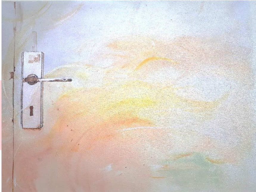
Gambar 3. 17 karya 5 “keluarlah kau masih berguna!”. 90cm x 70cm.