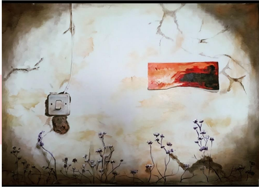
Gambar 3. 13 kanvas 1 “pesan dari rembesan air di tembok”. 90cm x 70cm.