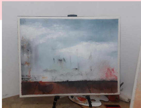
Gambar 3. 8 Progres karya 3.

Seketsa kanvas 4 mengarah pada objek jendela yang terbuka dan memancarkan sinar matahari kedalam ruangan. Dalam kanvas 4 ini lebeh menceritakan bagaimana cara untuk penulis mengahiri kegilaan dari halusinasi, dengan nekat untuk melihat keluar dan mencari udara segar. Disini juga terlihat beberapa kumpalan asap yang menandakan salah satu zat adiktif lain nya yang menyimbang halusinasi. Asap tersebut merupakan asap dari vape dengan liquid yang mengandung 30mg salt nicotine yang jika digunakan secara berlebihan menambah efek seperti tipsi ringan.