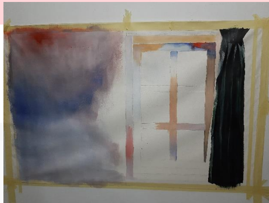
Gambar 3. 10 progres karya 4.

Kanvas ke 5 merupakan sebuah penutup dari rangkaian karya dalam tugas ini. Disini penulis memilih objek gagang pintu kamar sebagai symbol untuk segera keluar dari efek halusinasi. Dalam kanvas terakhir ini juga terlihat efek halusinasi akibat zat adiktif dan alkohol sudah mulai mereda dan juga pesan tersirat dimana audien atau publik dapat berpendapat tentang kesimpulan dari keseluruhan kanvas yang telah di tampilkan sebelumnya. Namun pada intinya zat adiktif dan alkohol sebaiknya dihindari walau sudah tertera legalitas dari BPOM dan pajak cukai negara, walaupun jika dalam sudut pandang lain memiliki kesan estetika dan pengalaman yang unik.