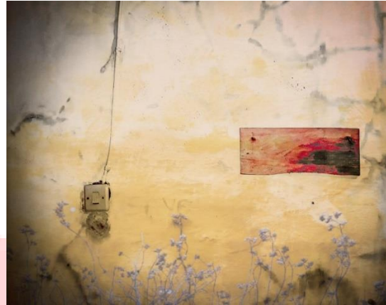
Gambar 3. 2 Sketsa karya 1.

Sketsa ini diambil dengan karena memiliki kesan kombinasi tekstur serta objek yang sederhana. Kesederhanaan ini menjadi perpaduan yang pas ketika sedang dalam pengaruh alkohol dan nikotin dalam jumlah berlebih yang memicu kesadaran otak untuk berimajinasi. Terlihat objek seperti saklar lampu dan kayu seperti tidak terdistorsi. Ini diakibatkan karena adanya konflik dimana otak berusaha menyeimbangkan fungsi organ dan sebagian lain nya mengalami halusinasi ringan. Halusinasi ringan ini yang penulis rasakan berpengaruh pada benda yang umum nya berwarna polos seperti putih ( green screen effect ). Selain itu ada sisi sejarah dari penulis yang tidak akan di paparkan dalam pengantar karya karena alasan privasi.