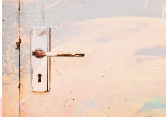
Gambar 3. 11 Sketsa karya 5.