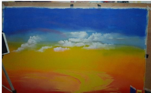
Gambar 3. 6 Progres karya 2..

Namun dalam pengerjaan nya penulis sengaja untuk mengeksekusi dikakhir dikarenakan ukuran yang cukup besar 150cm x 100cm yang akan memakan waktu lama dan tidak efektif jika di kerjakaan di awal. Berikut merupakan dokumentasi proses dari kanvas 2: