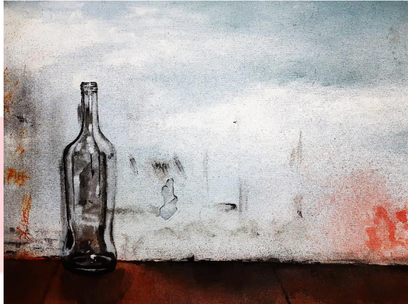
Gambar 3. 15 karya 3 “alasan klasik dari semua ini”. 90cm x 70cm.