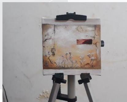
Gambar 3. 3 Prototype karya 1. 15cm x 15 cm.

Sketsa ini diambil dengan karena memiliki kesan kombinasi tekstur serta objek yang sederhana. Kesederhanaan ini menjadi perpaduan yang pas ketika sedang dalam pengaruh alkohol dan nikotin dalam jumlah berlebih yang memicu kesadaran otak untuk berimajinasi. Terlihat objek seperti saklar lampu dan kayu seperti tidak terdistorsi. Ini diakibatkan karena adanya konflik dimana otak berusaha menyeimbangkan fungsi organ dan sebagian lain nya mengalami halusinasi ringan. Halusinasi ringan ini yang penulis rasakan berpengaruh pada benda yang umum nya berwarna polos seperti putih ( green screen effect ). Selain itu ada sisi sejarah dari penulis yang tidak akan di paparkan dalam pengantar karya karena alasan privasi.