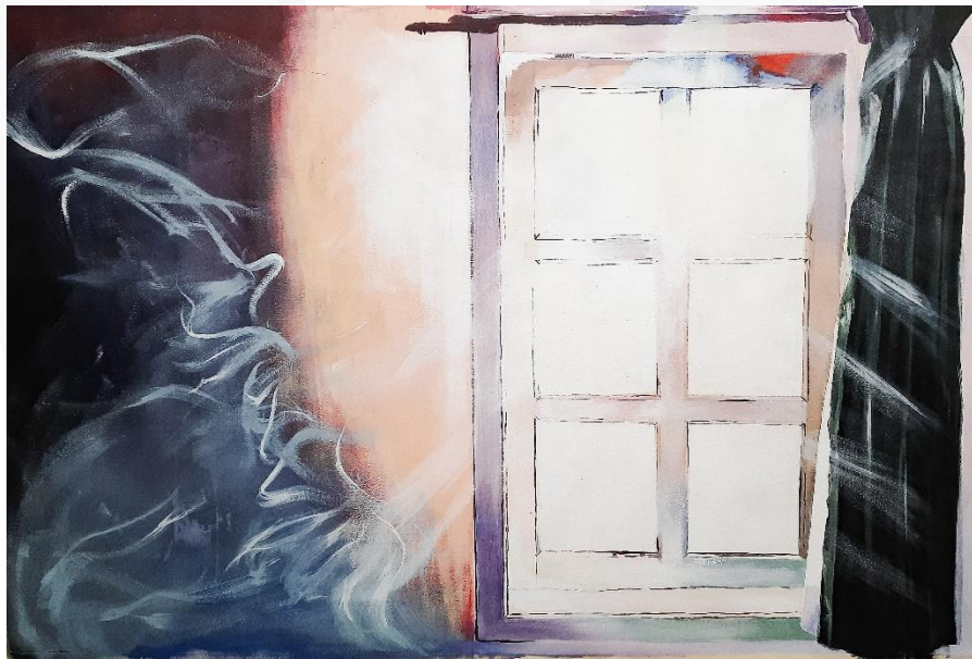
Gambar 3. 16 Karya 4 “melihat keluar empiris”. 140cm x 100cm.