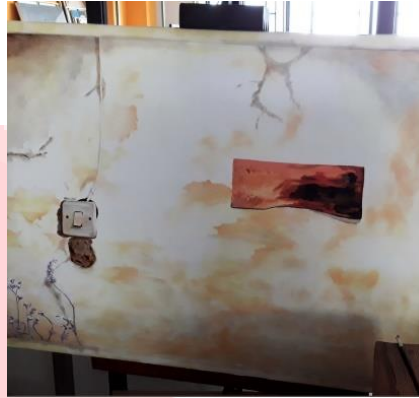
Gambar 3. 4 Progres karya 1.

Gambar diatas merupakan ujicoba atau prototype pengaplikasian terhadap media lukis untuk menentukan teknik yang tepat yang nanti akan di pindah ke media sesungguhnya. Berikut merupakan proses pengerjaan dari kanvas 1.