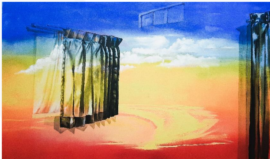
Gambar 3. 14 kanvas 2 “harap dan ekspektasi antar dimensi”. 150cm x 100cm.