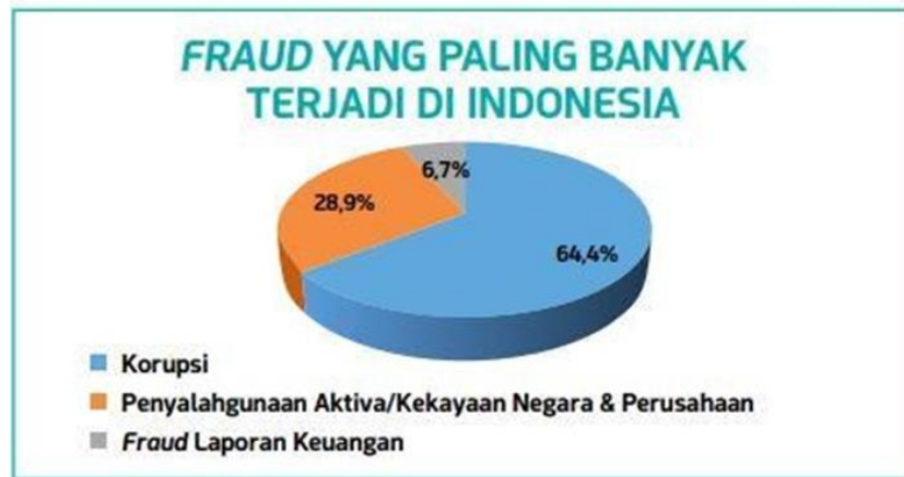
Gambar 1. 1 Fraud yang terjadi di Indonesia

Audit standar no 99 mendefinisikan Fraud merupakan tindakan yang muncul karena adanya niat yang menghasilkan kecurangan material. Niat merupakan upaya seseorang merencanakan sesuatu. Semakin besar niat seseorang melakukan suatu perilaku maka semakin besar kemungkinan dilakukannya (Gunawan et al., 2020). Pendapat Dinata et al., (2018) memberikan satu pandangan mengenai kebiasaan fraud . Bahwa sudah tidak bisa disangkal fraud ialah kegiatan jahat yang dianggap bisa membawa pengaruh buruk bagi individu, organisasi atau lingkungan di mana fraud itu terjadi, Ketika penipuan diterima sebagai praktik umum dan beberapa penipu percaya bahwa tindakan mereka adalah naluriah, hal ini malah menimbulkan tantangan baru.