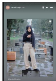
Gambar 1. 1. Celebrity Endorsment MySelf Jeans x Hanin Dhiya

Mereka yang menggunakan selebriti mereka untuk secara langsung atau tidak langsung menyebarkan pesan dan mengiklankan suatu barang atau jasa dikenal sebagai endorser (McCormick, 2016). Endorser adalah seorang tokoh masyarakat, artis, penghibur, olahragawan, atau tokoh lainnya yang terkenal di kalangan masyarakat karena keahliannya dalam industri tertentu. Studi "Pengaruh Iklan dan Endorser terhadap Kesadaran Merek dan Dampaknya pada Keputusan Pembelian" oleh (Setiawan B. &, 2019) menunjukkan bahwa endorser memiliki dampak yang besar dan menguntungkan terhadap kesadaran merek. Kesimpulan serupa diambil dari penelitian (Buana, 2019), "Analisis Pengaruh Celebrity Endorsement terhadap Brand Awareness Produk Erigo", yaitu bahwa endorsement memiliki dampak yang besar dan menguntungkan.