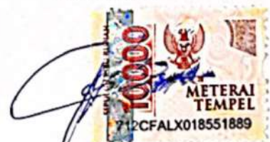
Agung Kade Griyantara