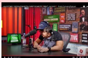
Tabel 4.7 Percakapan ke 7. Menit 46.39 - 47.26 - 50.14