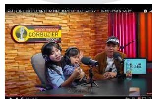
Tabel 4.5 Percakapan ke 5. Menit 26.21 - 27.16