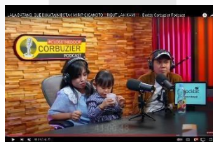
Tabel 4.6 Percakapan ke 6. Menit 40.10 - 41.39