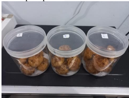
GAMBAR 2 Cookies A, B, dan C

Pengujian organoleptik inovasi cookies snickerdoodles dengan isian colenak dibagi menjadi 5 penilaian yaitu penilaian berdasarkan rasa, aroma, warna, tekstur dan penampilan fisik pada produk.