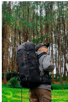
Gambar 1.3 Produk Outdoor Fashion Savana Indonesia

Selain itu, ada juga jenis atau gaya fashion outdoor. Menurut Ginting & Febriani, Casual outdoor wear yang dimaksud merujuk pada pakaian yang memiliki kelebihan untuk mendukung aktivitas di luar ruangan seperti mampu menghangatkan di saat suhu luar ruangan cenderung ekstrem, yang tentunya sengaja didesain untuk dapat digunakan pada acara non formal sehingga tetap memiliki kesan nyaman dipakai dan mampu menjadi identitas seseorang tanpa mengesampingkan kriteria pakaian outdoor itu sendiri.