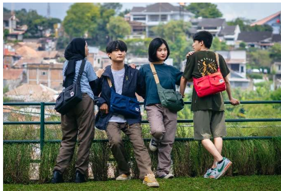
Gambar 1.2 Produk Urban Fashion Savana Indonesia

Menurut data yang diperoleh dari laman zalora.co.id, dalam perkembangannya, fashion hadir sebagai representasi dari kepribadian para penggunanya. Melihat perkembangan tersebut, para pelaku bisnis fashion meluncurkan beberapa jenis atau kategori gaya fashion. Salah satu gaya fashion yang populer pada masa kini adalah Urban Fashion. Urban sendiri memiliki makna Kawasan perkotaan. Maka dari itu, urban fashion merupakan perpaduan gaya dan mode yang dipengaruhi oleh budaya perkotaan. Urban fashion sendiri dipengaruhi oleh beberapa hal seperti trend fashion didunia, perkembangan teknologi di suatu kota, kehidupan sosial dan budaya kota, serta iklim dan suasana kota.