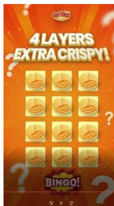
Gambar 4 Minigames guribee

Poster akan bersifat Informatif , ditempatkan di Mall untuk dapat dilihat pengunjung yang sedang berbelanja di mall.