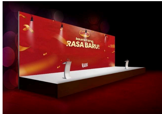
Gambar 3 Event