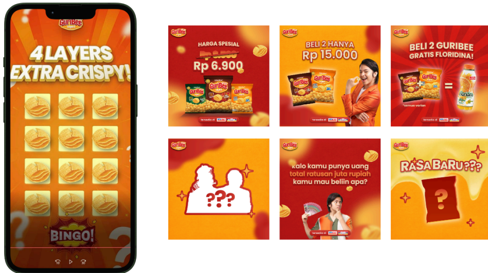
Gambar 7 Feeds Instagram & Story

Merchandise dapat berguna sebagai reminder yang diberikan kepada para pemenang (ibu dan anak) baik itu dalam permainan Bela saat event berlangsung, juga pemenang di tantangan media sosial Instagram.