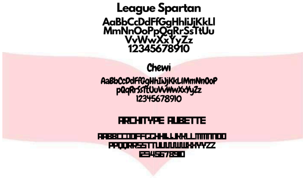
Gambar 2 Font