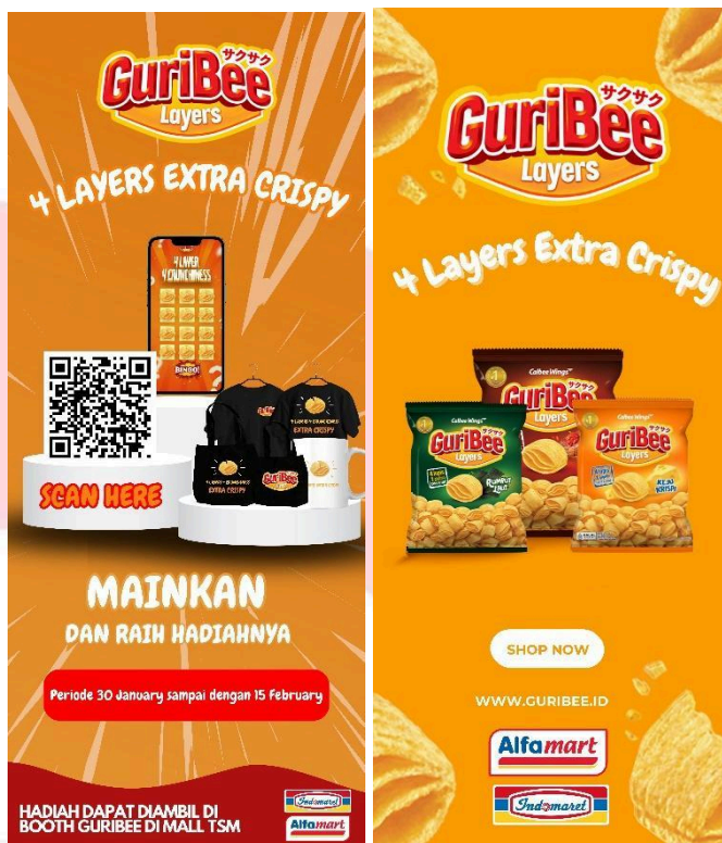
Gambar 6 X-Banner

X-Banner akan di pasang di setiap sudut event, dimana Isi dari Banner berupa awareness dan Informasi tentang merchandise guribee dan pengantar menuju Web resmi Guribee.id.