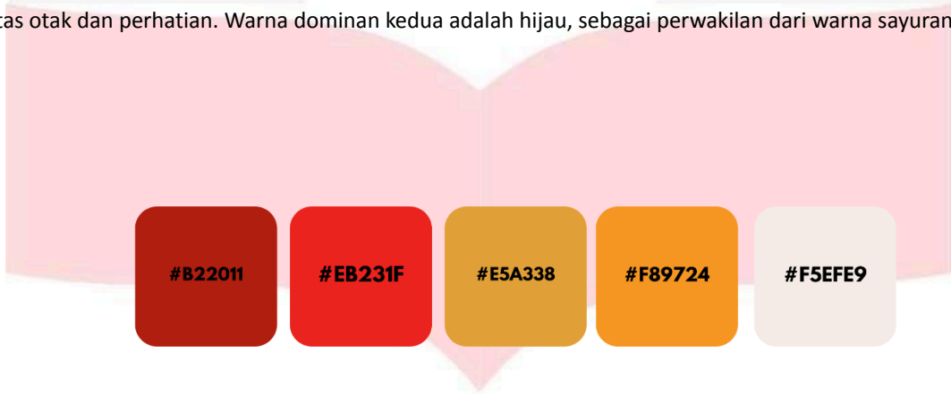
Gambar 2 Warna

Warna yang digunakan adalah warna cerah, karena didasari dengan warna buah-buahan dan sayuran itu sendiri. Warna dominan adalah warna kuning yang melambangkan hangat, semangat ceria, juga merangsang aktivitas otak dan perhatian. Warna dominan kedua adalah hijau, sebagai perwakilan dari warna sayuran .