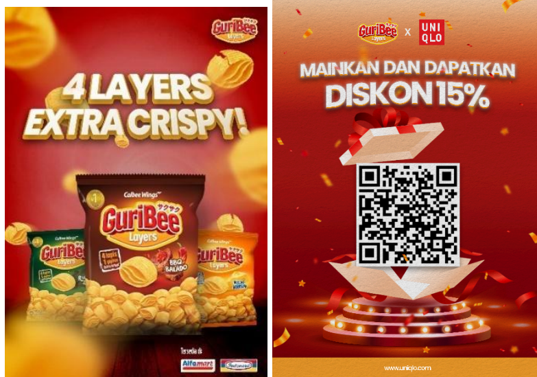
Gambar 4 Poster