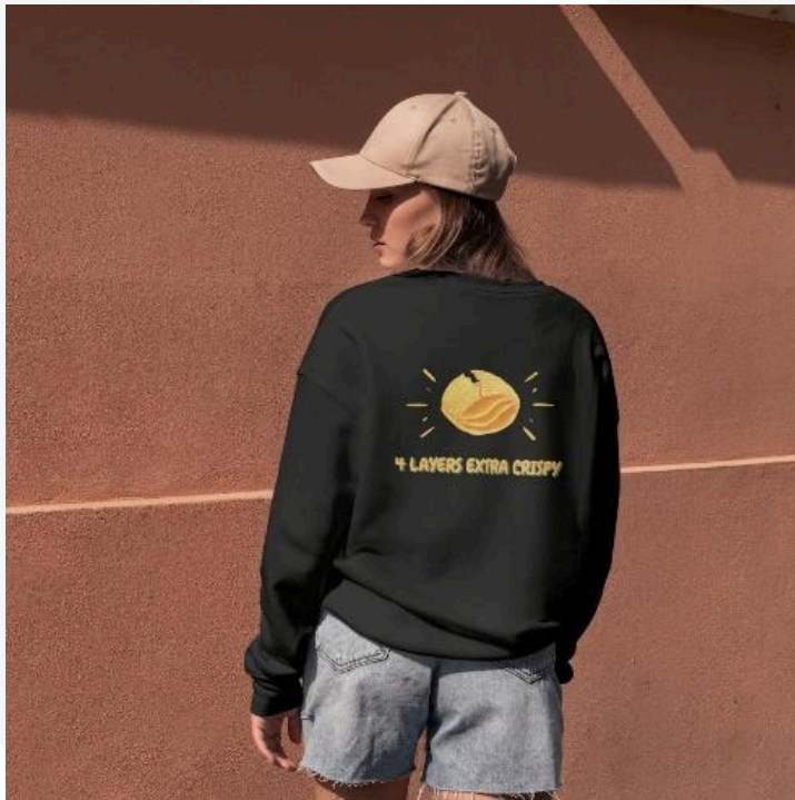
Gambar 11 Merchandise