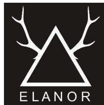
Gambar 1 Logo Elanor