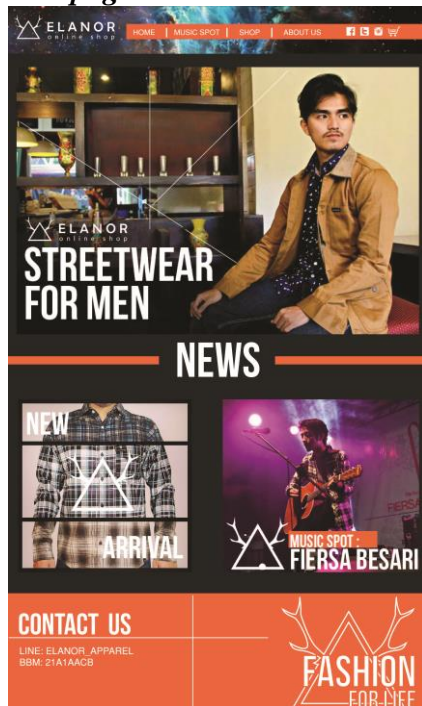
Gambar 5. Homepage