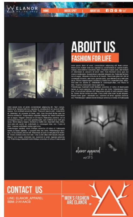
Gambar 7. Halaman About Us