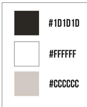
Gambar 3. Warna hitam, putih, dan abu abu

Untuk menunjukkan kesan atraktif pada desain web Elanor, warna yang dipakai adalah warna yang cerah, hal ini didasari juga pada target pasar Elanor yang menargetkan umur 18-30 tahun yang rata-rata masih memiliki jiwa muda. Oleh karena itu penulis memilih warna oranye sebagai warna yang dapat mewakili semangat, energi dan keseimbangan.