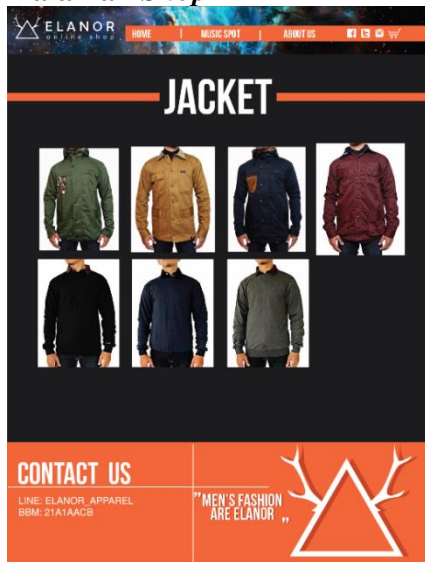
Gambar 6. Halaman Shop