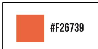
Gambar 4. Warna oranye

Untuk menunjukkan kesan atraktif pada desain web Elanor, warna yang dipakai adalah warna yang cerah, hal ini didasari juga pada target pasar Elanor yang menargetkan umur 18-30 tahun yang rata-rata masih memiliki jiwa muda. Oleh karena itu penulis memilih warna oranye sebagai warna yang dapat mewakili semangat, energi dan keseimbangan.