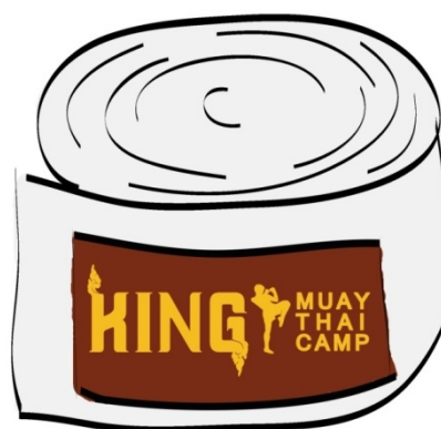
Gambar 19 Handwrap