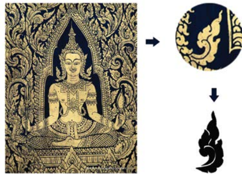
Gambar 2 Referensi Visual untuk Logotype

untuk Logotype dan Logogram adalah sebagai berikut: