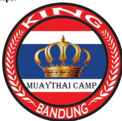
Gambar 1 Logo King Muay Thai Camp

King Muay Thai Camp merupakan salah satu tempat berlatih Muay Thai (sasana) di Bandung. Sasana ini berlokasi di Jalan Terusan Buah Batu No. 54 dan sudah berdiri