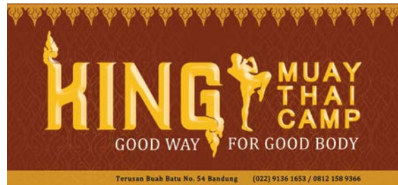
Gambar 10 Plang Nama