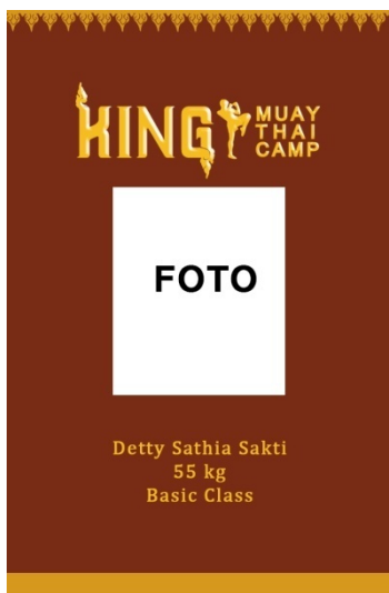
Gambar 16 ID Card

Ukuran : 8,5x5,5 cm Bahan : HVS 269gr Penerapan : dibagikan kepada anggota yang baru mendaftar