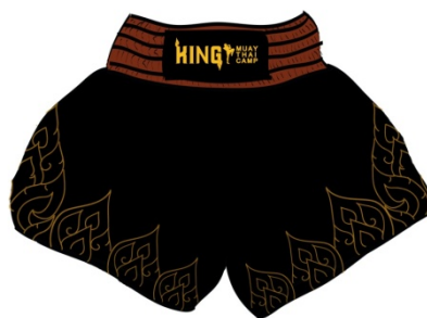
Gambar 18 Celana

Ukuran : 8,5x5,5 cm Bahan : HVS 269gr Penerapan : dibagikan kepada anggota yang baru mendaftar