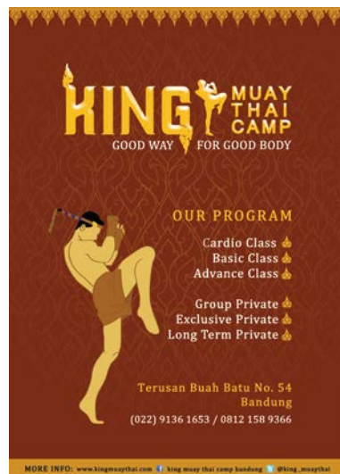
Gambar 13 Poster Intention

Ukuran : A2 Bahan : Art carton 260gr Penerapan : disebar di sekolah, kampus, dan tempat umum