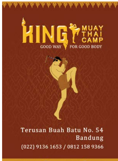
Gambar 12 Poster Attention