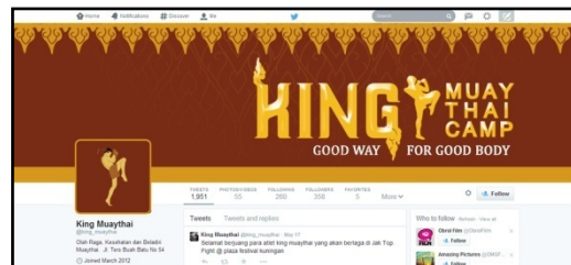
Gambar 22 Twitter Banner