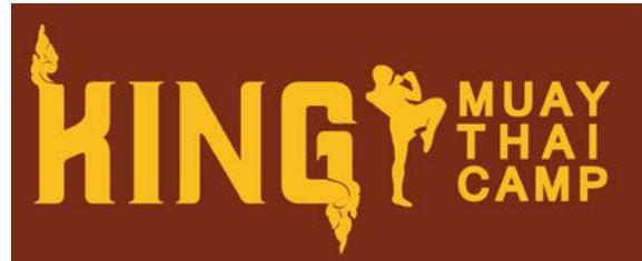
Gambar 9 Logo King Muay Thai Camp