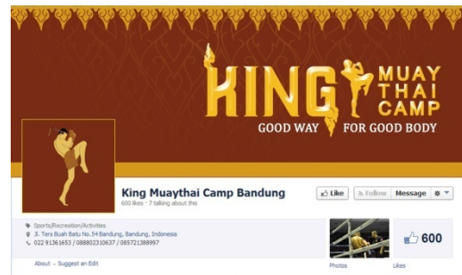
Gambar 21 Facebook Banner