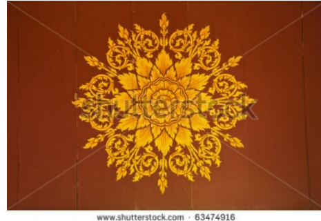
Gambar 5 Thailand Pattern sebagai Referensi Warna

Warna yang digunakan yaitu diambil dari pattern Thailand dengan tujuan kesan Thailand tetap terasa pada perancangan ini.