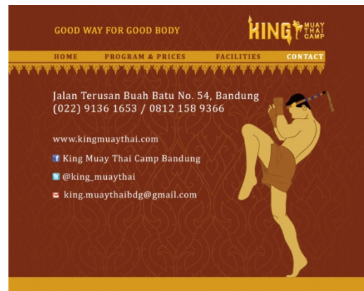
Gambar 20 Web