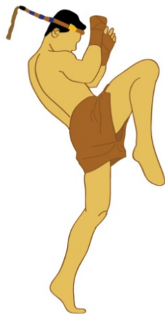
Gambar 4 Ilustrasi

Bentuk ilustrasi yang digunakan adalah orang dengan gerakan Muay Thai.