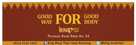
Gambar 11 Spanduk