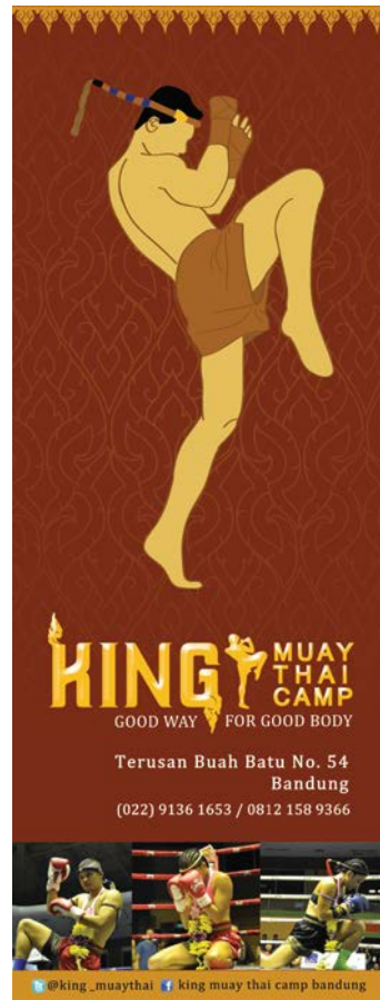
Gambar 14 X-Banner

Ukuran : A2 Bahan : Art carton 260gr Penerapan : disebar di sekolah, kampus, dan tempat umum