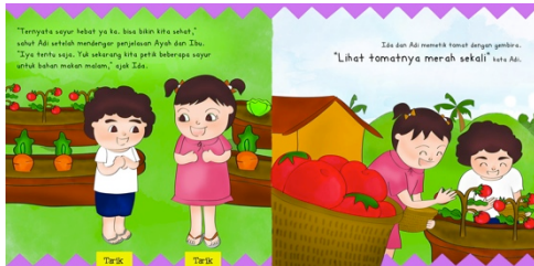
Gambar 17 Halaman 19-20

Sistem pop-up yang digunakan adalah gabungan dari angle fold pada Ibu dan flip the flap pada kotak coklat bertuliskan fungsi dari sayuran.