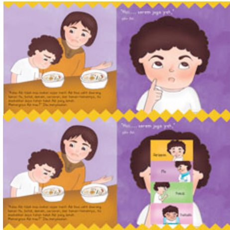
Gambar 12 Halaman 9-10

Dalam halaman ini Ibu menasehati dan menjelaskan kepada Adi tentang dampak dari tidak suka makan sayur. Dengan menggunakan sistem flip the flap pada halaman 10.