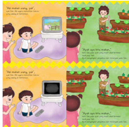
Gambar 10 Halaman 5-6 Sebelum dan Sesudah di Tarik

Sistem pop-up yang digunakan adalah tube post armature pada tanaman pada meja dapur. Ketika halaman di buka meja dapur akan terlihat 3 dimensi.