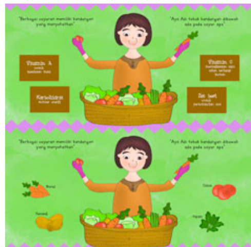
Gambar 16 Halaman 17-18 Sebelum dan Sesudah di Buka

Sistem pop-up yang digunakan adalah wheel tab yang terdapat pada halaman 16. Adegan yang terjadi adalah ayah menjelaskan kepada Adi tentang tumbuh kembang yang terjadi pada halaman tomat.