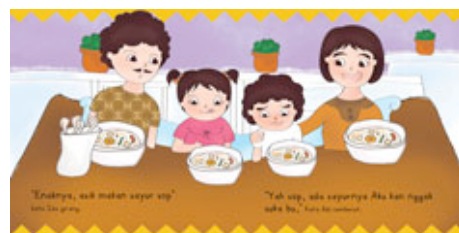
Gambar 11 Halaman 7-8

Sistem pop-up yang digunakan adalah pull tab pada televisi dan perubahan ekspresi ayah dengan cara ditarik. Pada halaman 5 Ida sedang memanggil Adi untuk makan bersama, Adi bergegas mematikan televisi. Kemudian pada halaman 6 Ida juga memanggil Ayah untuk makan bersama, ketika ditarik maka terjadi perubahan gesture dan ekspresi Ayah.