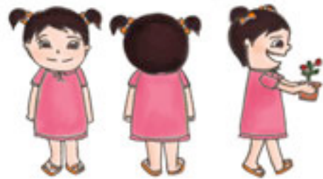
Gambar 2 Karakter Ida

Karakter dan penokohan yang terdapat dalam cerita adalah sebagai berikut :