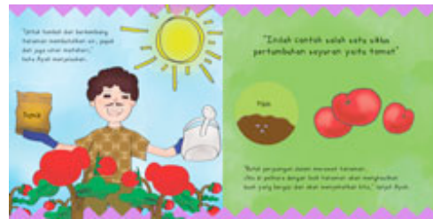
Gambar 15 Halaman 15-16

Sistem pop-up yang digunakan adalah flip the flap pada halaman 13-14. Adegan pada halaman ini, setelah makan siang lalu pembaca membuka gambar pintu kemudian muncul adegan Ayah, Ibu, Ida, dan Adi yang tiba di kebun belakang rumah.