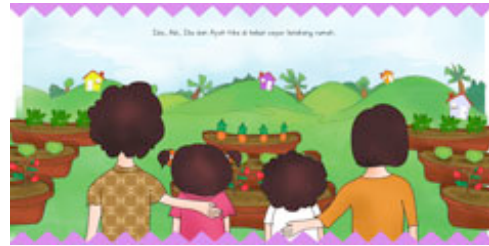
Gambar 14 Halaman 13-14 Sebelum dan Sesudah di Buka

Sistem pop-up yang digunakan adalah flip the flap pada halaman 13-14. Adegan pada halaman ini, setelah makan siang lalu pembaca membuka gambar pintu kemudian muncul adegan Ayah, Ibu, Ida, dan Adi yang tiba di kebun belakang rumah.