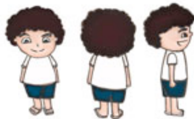
Gambar 3 Karakter Adi