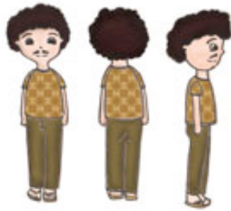
Gambar 5 Karakter Ayah