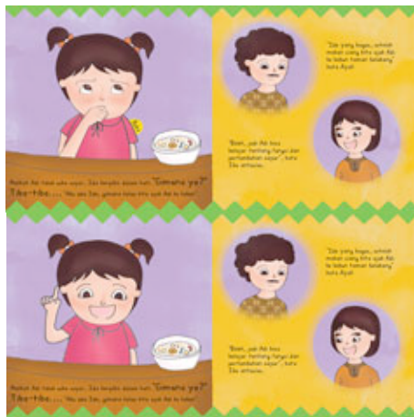
Gambar 13 Halaman 11-12

Dalam halaman ini Ibu menasehati dan menjelaskan kepada Adi tentang dampak dari tidak suka makan sayur. Dengan menggunakan sistem flip the flap pada halaman 10.