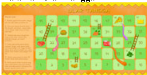
Gambar 19 Ular tangga