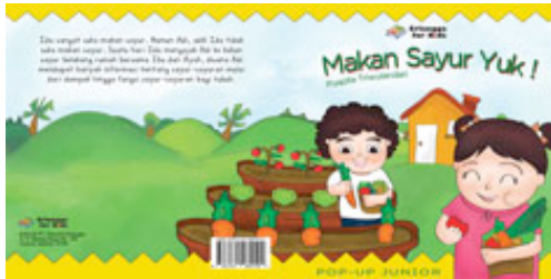
Gambar 7 Cover Depan dan Belakang