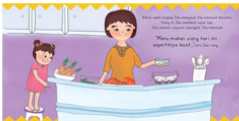
Gambar 9 Halaman 3-4

Sistem pop-up yang digunakan adalah angle fold pada tanaman wortel.