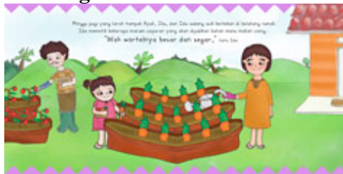
Gambar 8 Halaman 1-2

Sistem pop-up yang digunakan adalah angle fold pada tanaman wortel.