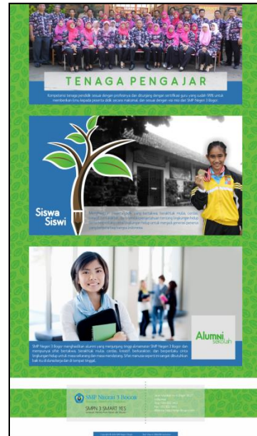
Gambar 7 Tampilan website bagian kedua