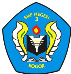
Gambar 1 logo SMP Negeri 3 Bogor

SMP Negeri 3 Bogor merupakan salah satu sekolah menengah pertama formal yang