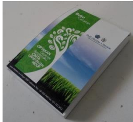
Gambar 19 Tampilan desain buku catatan