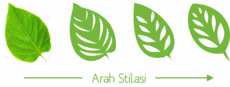
Gambar 4 Stilasi ilustrasi daun

tersendiri. Ilustrasi yang dihasilkan yaitu ilustrasi hasil stilasi dari daun tanaman dan stilasi pohon.