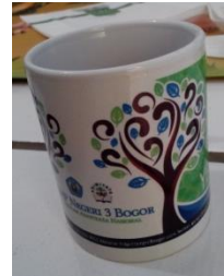
Gambar 15 Tampilan desain mug