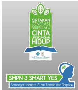
Gambar 17 Tampilan desain sticker