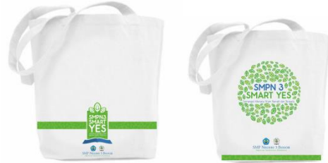
Gambar 13 Tampilan desain Goodie Bag