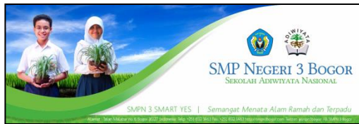
Gambar 11 Tampilan desain Horizontal Banner