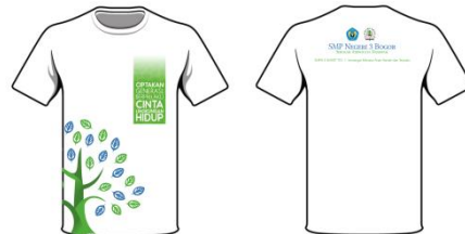
Gambar 16 Tampilan desain t-shirt