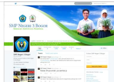
Gambar 9 Tampilan desain pada Twitter