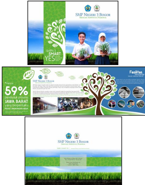
Gambar 10 Tampilan desain brosur