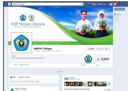
Gambar 8 Tampilan desain pada Facebook