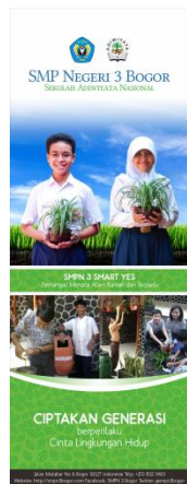
Gambar 12 Tampilan desain X Banner