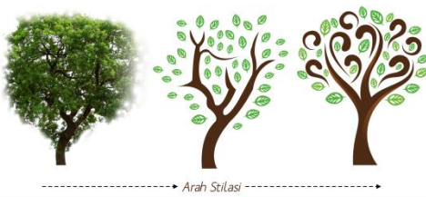
Gambar 5 Stilasi ilustrasi pohon