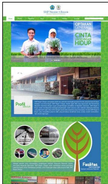
Gambar 6 Tampilan website bagian pertama