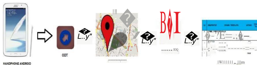
Gambar 3.1 Gambaran Umum Aplikasi.